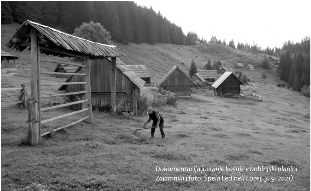
Dokumentacija jutranje košnje v bohinski planini Zajamniki.