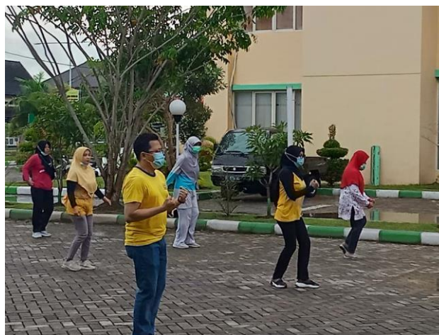
Gambar 2. Gerakan Warming Up (Pemanasan)

Tahapan Warming up merupakan gerakan awal dalam kegiatan senam dengan tujuan untuk meregangkan otot-otot. Gerak pemanasan sebaiknya secara rutin dan perlahan hal tersebut agar otot-otot tubuh terbiasa dengan berbagai gerakan pemanasan (Putri, 2020). Gerak pemanasan juga tidak boleh dilakukan dengan paksaan karena dapat berdampak cedera. Pemanasan sendiri bertujuan untuk mempersiapkan otot dan persendian, meningkatkan sirkulasi cairan tubuh, denyut jantung dan suhu tubuh secara bertahap (Mirawati, dkk., 2020). Gerakan-gerakan yang dipandu instruktur olah raga senam (TIM PkM) dalam pemanasan adalah memutar kepala, memutar pinggang, memutar bahu, memutar kedua lengan, menekuk pergelangan kaki, menekuk pergelangan tangan, meluruskan kaki, dan menekuk tubuh depan. Gerakan-gerakan sederhana ini dirasakan cukup efektif untuk meregangkan otot sebelum memulai gerakan inti dalam olah raga senam.