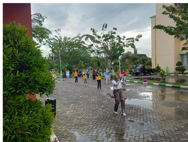
Gambar 3. Gerakan Core (Inti)

Tahap Core atau gerakan inti adalah gerakan setelah proses pemanasan. Gerakan ini lebih aktif dan variatif menyesuaikan dengan jenis senam yang dilakukan. Gerakan inti adalah gerakan di tengah-tengah latihan. Biasanya, bentuk gerakannya sudah aktif dan mengikuti aliran tertentu. Gerakan inti bertujuan untuk memperkuat otot-otot tubuh dan melatih koordinasi gerakan antar anggota badan (Mirawati, dkk., 2020).