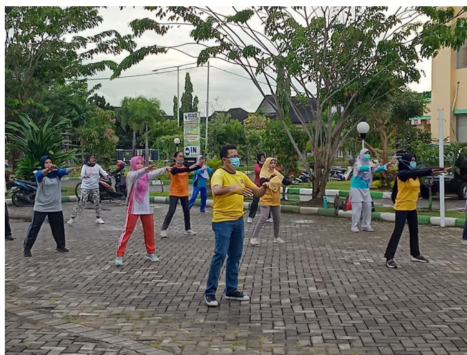
Gambar 4. Gerakan Cooling Down (Pendinginan)

Tahap Cooling Down atau pendinginan merupakan fase mengembalikan kondisi tubuh setelah gerakan inti dalam olahraga dilakukan. Tujuan dari bagian ini adalah untuk mengembalikan fungsi fisik secara bertahap ke kondisi sebelum berolahraga yang ditandai dengan penurunan suhu tubuh, penurunan keringat, dan detak jantung normal. Selain untuk mencegah cedera dan menghilangkan rasa sakit. Gerakan ini sebaiknya dilakukan untuk menurunkan denyut nadi, mulai dari gerakan cepat hingga gerakan lambat dan gerakan berat hingga ringan (Sriwahyuniati & Budiarti, 2016). Gerakan ini wajib dilakukan untuk menurunkan denyut nadi yang dimulai dengan gerakan yang cepat ke lambat serta gerakan yang berat ke ringan, selain itu untuk mencegah terjadinya cedera dan membantu mengatasi nyeri. Menurut Shafa (2020) pendinginan dapat meningkatkan level oksigen dan aliran darah, serta membantu mengalirkan nutrisi ke seluruh otot dan tubuh. Adapun tahapan sebagai berikut, 1) Quadruped Thoracic Rotation , 2) Lying Pec Stretch 3) Lunge With Spinal Twist , 4) Inchworm , dan 5) Child's Pose