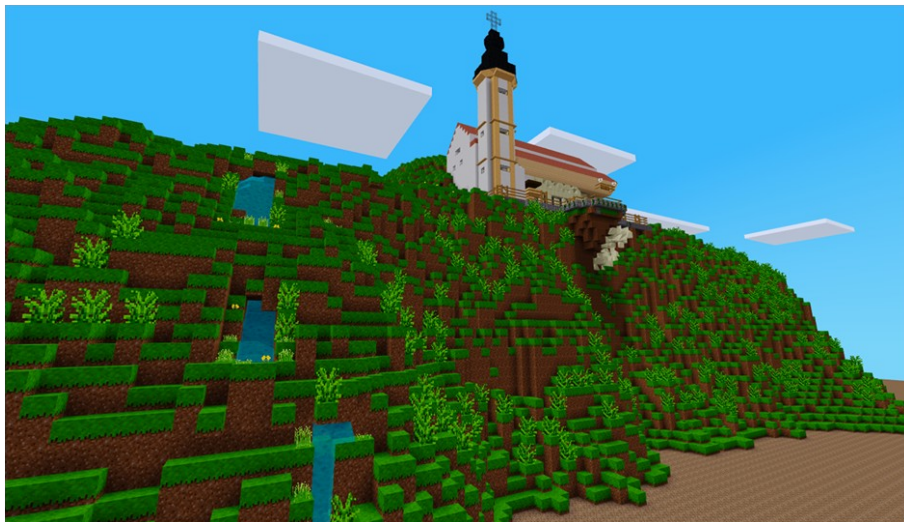
Abbildung 2: St. Salvator Kirche auf dem Nepperberg

Ich wollte dann einen Berg bauen. Da ging das bei mir los. Ich hab gemerkt, ich krieg das einigermaßen hin, das hat mir dann auch echt Spaß gemacht und dann saß man halt echt bis nachts am Laptop und hat das gemacht. Mein Freund wollte dann ins Bett aber ich so nee, ich musste weiter machen, ich konnte da jetzt nicht aufhören.