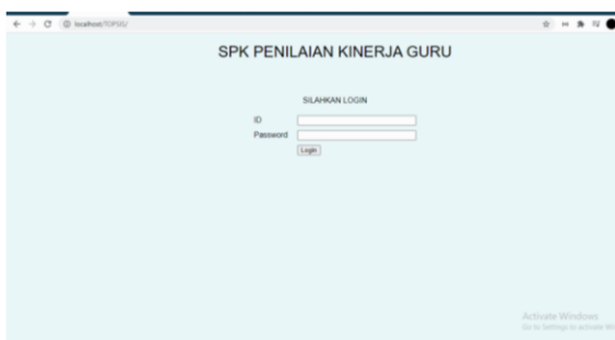
Gambar 2. Login Sistem 2. Halaman Kriteria

Untuk masuk ke dalam sistem kepala sekolah dan guru harus login terlebih dahulu menggunakan id dan password.