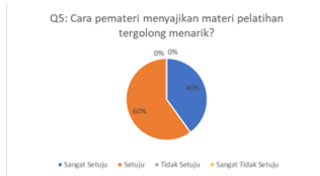
Gambar 6. Hasil Kuesioner Mengenai Cara Penyampaian Materi

Berdasarkan grafik pada gambar 6 dapat dilihat bahwa sebanyak 60% peserta menjawab setuju dan 40% peserta menjawab sangat setuju. Artinya materi telah disampaikan secara menarik oleh narasumber. Pertanyaan kuesioner keenam terkait dengan layanan yang diberikan oleh anggota pendamping pelatihan. Hasil pengisian kuesioner dapat dilihat pada Gambar 7.