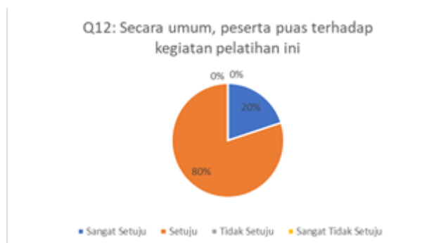
Gambar 13. Hasil Kuesioner Mengenai Tingkat Kepuasan Peserta Terhadap Kegiatan Pelatihan

Pertanyaan kuesioner dua belas terkait dengan tingkat kepuasan peserta terhadap kegiatan pelatihan yang dilakukan. Hasil pengisian kuesioner dapat dilihat pada Gambar 13.