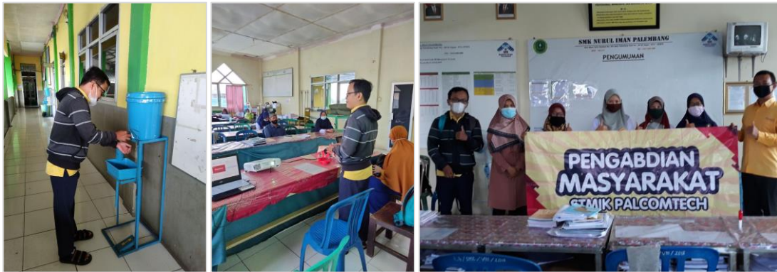
Gambar 1. Kegiatan Pelatihan

Kegiatan pelatihan dilakukan dengan metode workshop [13], pelatihan dilakukan selama satu hari pada Senin, tanggal 8 Februari 2021. Pelatihan dimulai pada pukul 08:00 sampai dengan 14:00 berlokasi di Sekolah SMK Nurul Iman Palembang. Materi Powerpoint yang disampaikan menitik beratkan pada penggunaan grafis dan animasi pada bahan ajar, seperti: pemilihan font , tata letak ( layout ), penyisipan gambar, pemilihan warna, pembuatan animasi sederhana dan video. Dimana peserta pelatihan adalah tenaga pendidik yang berjumlah lima orang. Jumlah peserta pelatihan merupakan perwakilan yang dipilih oleh Kepala Sekolah dari tenaga pendidik yang ada, dan peserta pelatihan ditugaskan oleh Kepala Sekolah agar dapat mendistribusikan ilmu yang didapat kepada semua rekan tenaga pendidik di lingkungan SMK Nurul Iman Palembang. Pembatasan peserta pelatihan ini juga dalam rangka menerapkan Protokol Kesehatan untuk menghindari kumpulan peserta pelatihan yang banyak di masa Pandemi Covid-19, karena pada kegiatan pelatihan ini tetap menerapkan Protokol Kesehatan 3M yaitu memakai masker, mencuci tangan, menjaga jarak dan menghindari kerumunan [14]. Kegiatan pelatihan dapat dilihat pada Gambar 1.