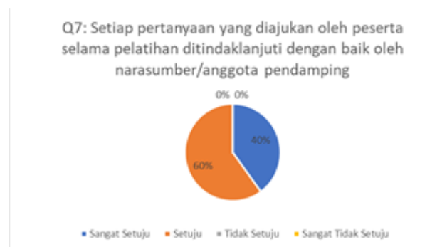
Gambar 8. Hasil Kuesioner Mengenai Tindak Lanjut Narasumber/Anggota Pendamping Terhadap Setiap Pertanyaan dari Peserta

Berdasarkan grafik pada gambar 7 dapat dilihat bahwa sebanyak 60% peserta menjawab setuju dan 40% peserta menjawab sangat setuju. Artinya layanan yang diberikan oleh anggota pendamping selama proses pelatihan sudah baik bagi peserta pelatihan. Pertanyaan kuesioner ketujuh terkait dengan tindak lanjut narasumber atau anggota pendamping terhadap setiap pertanyaan yang diajukan oleh peserta selama proses pelatihan. Hasil pengisian kuesioner dapat dilihat pada Gambar 8.