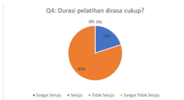
Gambar 5. Hasil Kuesioner Mengenai Durasi Pelatihan

Berdasarkan grafik pada gambar 4 dapat dilihat bahwa sebanyak 40% menjawab setuju dan 60% menjawab sangat setuju. Artinya materi yang disampaikan sudah jelas dan dapat dipahami oleh peserta pelatihan. Pertanyaan kuesioner keempat terkait dengan durasi pelatihan yang dilaksanakan. Hasil pengisian kuesioner dapat dilihat pada Gambar 5.