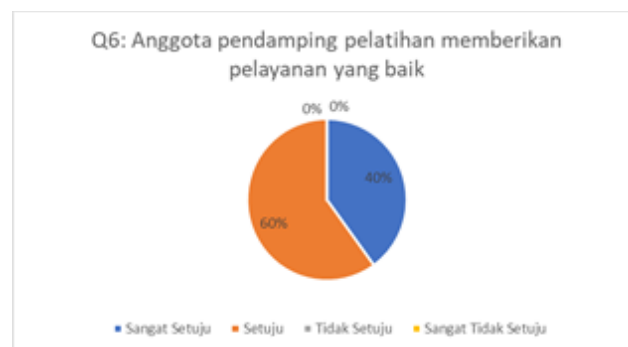
Gambar 7. Hasil Kuesioner Mengenai Layanan Anggota Pendamping

Berdasarkan grafik pada gambar 6 dapat dilihat bahwa sebanyak 60% peserta menjawab setuju dan 40% peserta menjawab sangat setuju. Artinya materi telah disampaikan secara menarik oleh narasumber. Pertanyaan kuesioner keenam terkait dengan layanan yang diberikan oleh anggota pendamping pelatihan. Hasil pengisian kuesioner dapat dilihat pada Gambar 7.