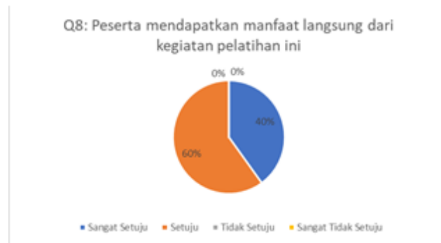
Gambar 9. Hasil Kuesioner Mengenai Manfaat Langsung dari Kegiatan Pelatihan

Berdasarkan grafik pada gambar 9 dapat dilihat bahwa sebanyak 60% peserta menjawab setuju dan 40% peserta menjawab sangat setuju. Artinya peserta pelatihan merasa ada manfaat secara langsung dari kegiatan pelatihan yang dilakukan. Pertanyaan kuesioner sembilan terkait dengan keberhasilan kegiatan pelatihan apakah dapat menambah pengetahuan peserta pelatihan. Hasil pengisian kuesioner dapat dilihat pada Gambar 10.