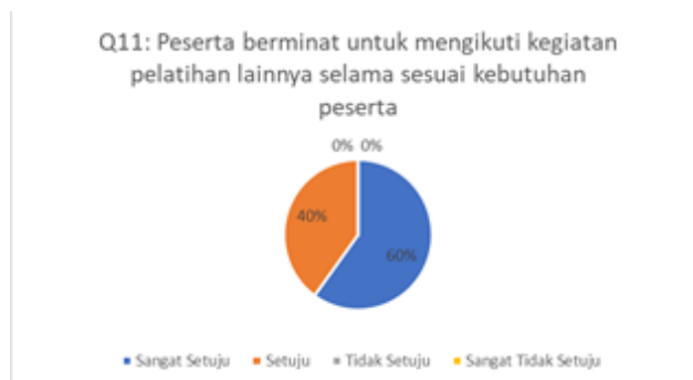
Gambar 12. Hasil Kuesioner Mengenai Tingkat Minat Peserta untuk Mengikuti Kegiatan Pelatihan

Pertanyaan kuesioner dua belas terkait dengan tingkat kepuasan peserta terhadap kegiatan pelatihan yang dilakukan. Hasil pengisian kuesioner dapat dilihat pada Gambar 13.