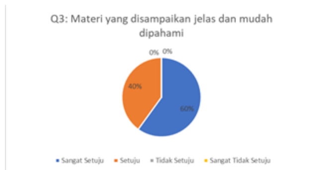
Gambar 4. Hasil Kuesioner Mengenai Kejelasan dan Pemahaman Materi

Berdasarkan grafik pada gambar 3 dapat dilihat bahwa sebanyak 60% menjawab setuju dan 40% menjawab sangat setuju. Artinya materi yang disampaikan sudah sesuai dengan kebutuhan peserta pelatihan. Pertanyaan kuesioner ketiga terkait dengan kejelasan dan pemahaman materi yang disampaikan kepada peserta pelatihan. Hasil pengisian kuesioner dapat dilihat pada Gambar 4.