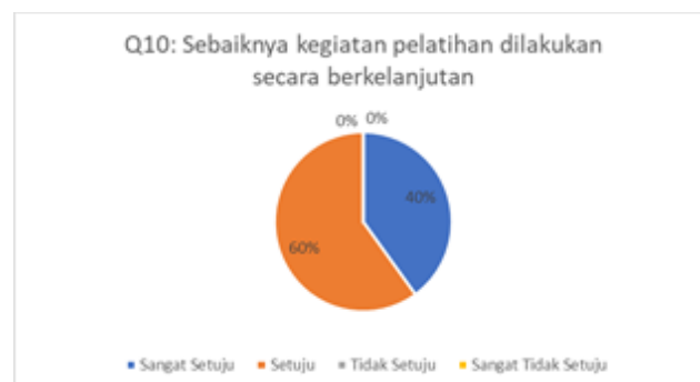
Gambar 11. Hasil Kuesioner Mengenai Keberlanjutan Kegiatan Pelatihan

Berdasarkan grafik pada gambar 10 dapat dilihat bahwa sebanyak 20% peserta menjawab setuju dan 80% peserta menjawab sangat setuju. Artinya peserta pelatihan merasa kegiatan pelatihan berhasil menambah pengetahuan baru tentang penggunaan Powerpoint untuk dapat diterapkan dalam pembuatan bahan ajar. Pertanyaan kuesioner sepuluh terkait dengan keberlanjutan kegiatan pelatihan apakah dapat dilakukan. Hasil pengisian kuesioner dapat dilihat pada Gambar 11.