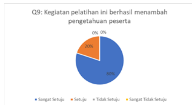
Gambar 10. Hasil Kuesioner Mengenai Keberhasilan Pelatihan dalam Menambah Pengetahuan Peserta

Berdasarkan grafik pada gambar 9 dapat dilihat bahwa sebanyak 60% peserta menjawab setuju dan 40% peserta menjawab sangat setuju. Artinya peserta pelatihan merasa ada manfaat secara langsung dari kegiatan pelatihan yang dilakukan. Pertanyaan kuesioner sembilan terkait dengan keberhasilan kegiatan pelatihan apakah dapat menambah pengetahuan peserta pelatihan. Hasil pengisian kuesioner dapat dilihat pada Gambar 10.