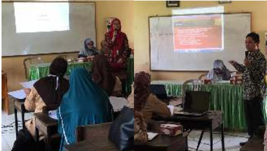
Gambar 4. Khalayak Sasaran dan Tim Penyampai Materi

Sebelum penyampaian materi PTK dan penulisan karya ilmiah, diberikan kuesioner kegiatan untuk melihat kemampuan dan pemahaman materi kegiatan sebelum dan sesudah penyampaian materi. Kuesioner dimaksudkan untuk melihat apakah penyampaian materi memberikan perubahan pemahaman yang signifikan terhadap peserta kegiatan. Hasil penilaian kuesioner dan butir pertanyaan diberikan pada Tabel 1.