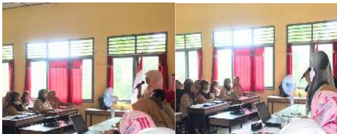
Gambar 3. Kegiatan Pembukaan

Kegiatan pengabdian dibagi dalam dua tahap, yaitu tahap pelaksanaan dan tahap pendampingan. Kegiatan pengabdian kepada masyarakat dengan judul “Pendampingan kepada Guru-Guru SD di Desa Sakatiga dalam Merancang Penelitian Tindakan Kelas dan Penulisan Publikasi” dilaksanakan pada tanggal 18 September 2019. Khalayak sasaran kegiatan ini adalah guru-guru SDN di wilayah Sakatiga berjumlah 25 orang. Kegiatan dibuka dengan sambutan dari ibu koordinator wilayah dan sambutan ketua tim pengabdian. Dokumentasi kegiatan diberikan pada Gambar 3.