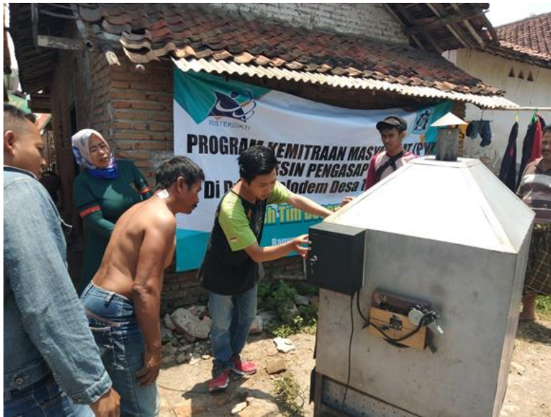
Gambar 3. Mahasiswa memberikan pelatihan penggunaan mesin