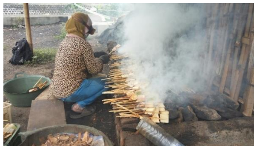
Gambar 1. Mitra melakukan proses pengasapan ikan secara manual

Proses pengasapan ikan setiap harinya membutuhkan kapasitas 1 ton dengan cara tradisional yang menggunakan 1 orang pekerja selama 5 jam, sehingga dalam proses tersebut memerlukan tenaga yang ekstra. Pekerja menggunakan tenaganya untuk membolak balik ikan yang diasap, mengkipas bara dan yang berbahaya bagi pekerja adalah asap yang dikeluarkan oleh bahan bakar sehingga dapat mengganggu pernafasan pekerja dan membuat mata perih. Asap hasil pembakaran juga menyebabkan polusi bagi lingkungan sekitar area kerja. Tungku yang digunakan pada cara tradisional ini diletakkan di ruang terbuka menyebabkan asap yang keluar tidak terarah dan membuat polusi (Gambar 1).