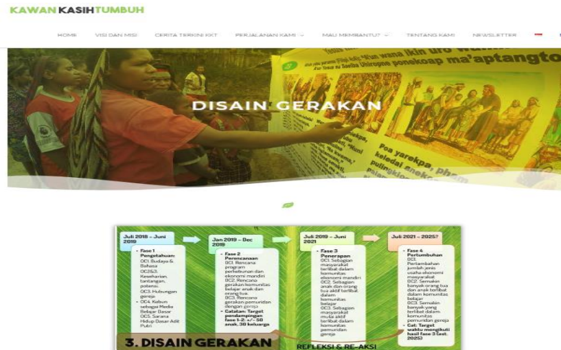
Gambar 5. Halaman Perjalanan Kami Website Kawan Kasih Tumbuh (KKT)

Seperti yang sudah disebutkan sebelumnya, media sosial yang dibuat adalah Facebook dan Instagram dengan nama akun @KawanKasihTumbuh. Media sosial yang pertama adalah Facebook Page dengan alamat www.facebook.com/KawanKasihTumbuh seperti gambar 6. Semua unggahan konten dalam halaman ini disesuaikan dengan informasi di dalam website.