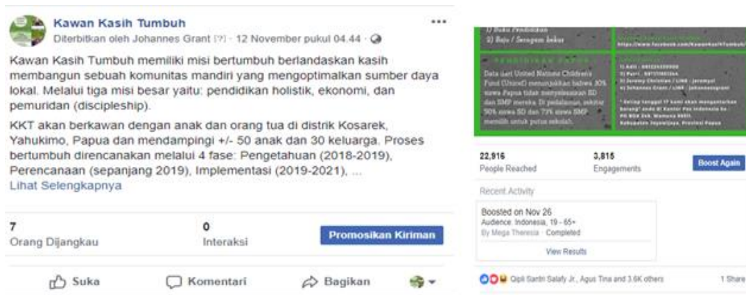
Gambar 7. Perbandingan sebelum dan setelah paid promote

Media sosial yang kedua adalah Instagram dengan alamat www.instagram.com/KawanKasihTumbuh seperti gambar 7. Semua unggahan konten dalam Instagram berupa kegiatan-kegiatan keseharian yang dilakukan oleh komunitas Kawan Kasih Tumbuh (KKT) di Papua.