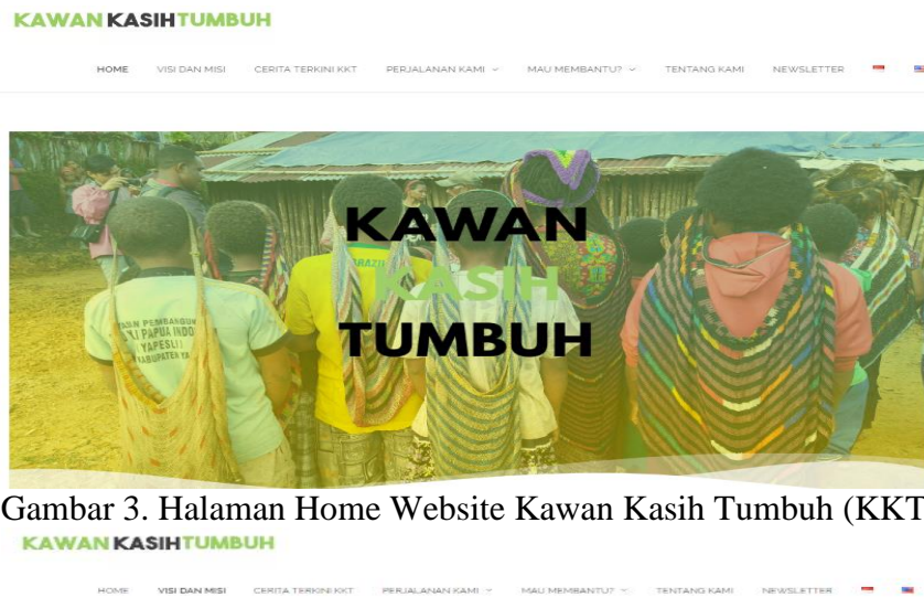
Gambar 3. Halaman Home Website Kawan Kasih Tumbuh (KKT)