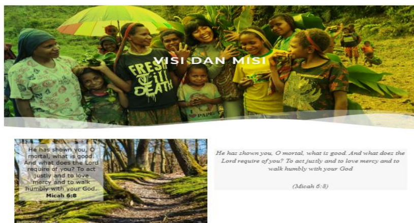
Gambar 4. Halaman Visi Misi Website Kawan Kasih Tumbuh (KKT)