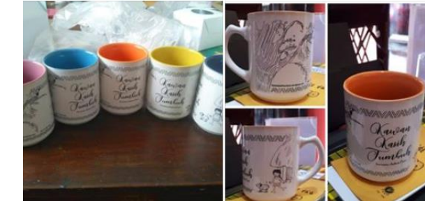
Gambar 2. Pengumpulan dana melalui Facebook