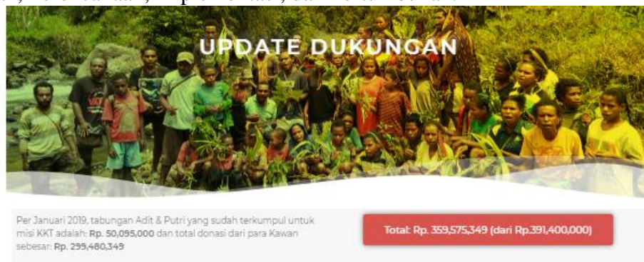
Gambar 10. Update dukungan dana

Gambar 9 menunjukkan bahwa total donasi yang diperlukan oleh Kawan Kasih Tumbuh (KKT) adalah sejumlah Rp 391.400,000. Dana tersebut dibutuhkan untuk mendukung operasional gerakan Kawan Kasih Tumbuh (KKT) yang akan dilaksanakan dalam fase Pengetahuan, Perencanaan, Implementasi, dan Pertumbuhan.