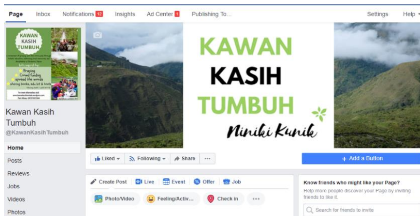
Gambar 6. Profile page Facebook Kawan Kasih Tumbuh (KKT)

Seperti yang sudah disebutkan sebelumnya, media sosial yang dibuat adalah Facebook dan Instagram dengan nama akun @KawanKasihTumbuh. Media sosial yang pertama adalah Facebook Page dengan alamat www.facebook.com/KawanKasihTumbuh seperti gambar 6. Semua unggahan konten dalam halaman ini disesuaikan dengan informasi di dalam website.