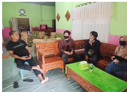
Gambar 1. Wawancara dengan Kepala Desa Molintogupo

Berdasarkan wawancara dengan Kepala Desa Molintogupo (17 Maret 2021) terungkap bahwa Desa Molintogupo adalah salah satu desa (dataran rendah, dan sungai Bolango) yang memiliki potensi pertanian dan peternakan yang perlu dikembangkan, namun masyarakat yang ada di Desa Molintogupo banyak yang hidup dibawah garis kemiskinan sebagai dampak dari bencana alam yang tidak menentu setiap tahunnya seperti banjir (5-7 kali dalam setahun). Akibat dari bencana ini kerugian yang harus diterima/dirasakan oleh masyarakat sangat banyak mulai dari gagal panen sampai pada harga jual hasil panen yang jauh dibawah modal kerja yang sudah dikeluarkan, hal ini diakibatkan oleh ketidaktahuan masyarakat dalam menghadapi bencana. Sebagian besar (178 orang) penduduk Desa Molintogupo berprofesi sebagai petani dan PNS 22 orang, wiraswasta sebanyak 35 orang, selebihnya berprofesi sebagai Peternak, pedagang, dll.