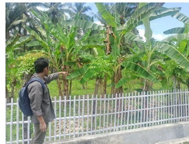
Gambar 2. Proses Survey Lokasi