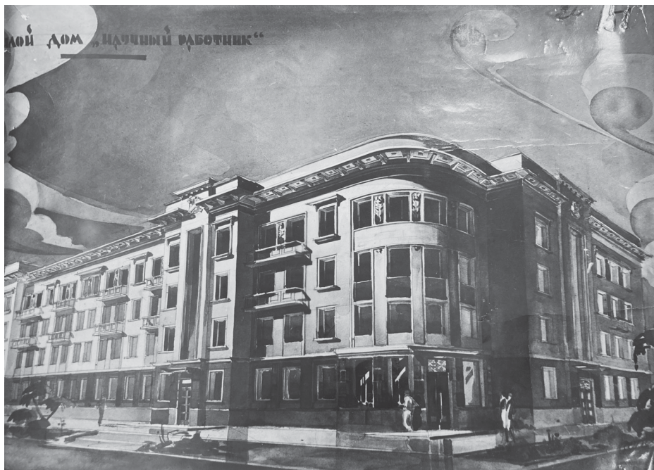
Ил. 1. Жилой дом «Научный работник»: проект [ГАРФ, ф. А-7790, оп. 1, ед. хр. 450, л. 150]

Кирпичный жилой дом на 30 квартир для РЖСКТ «Научный работник» предполагалось построить в г. Омск на угловом участке по Интернациональной ул. и Гражданскому пер. На этой территории уже имелось два двухэтажных каменных и два одноэтажных деревянных дома, смешанный дом, принадлежавший овчинно-шубному заводу. Все вышеуказанные здания подлежали выкупу — деревянные и смешанный дом были снесены, два каменных оставлены. В подлежащих сносу домах проживало 19 семей, которые должны были быть переселены [ГАРФ, ф. А-7790, оп. 1, ед. хр. 450, л. 10]. Несмотря на затраты, из всех предложенных к выбору участков под застройку дома «Научный работник» избранный участок являлся наиболее экономичным как по сносу строений, так и по отсутствию вблизи грунтовых вод. Кроме того, вблизи дома проходили водопроводная и канализационная линии. Здание находилось в центре, в непосредственной близости от Университета [Там же, л. 11].