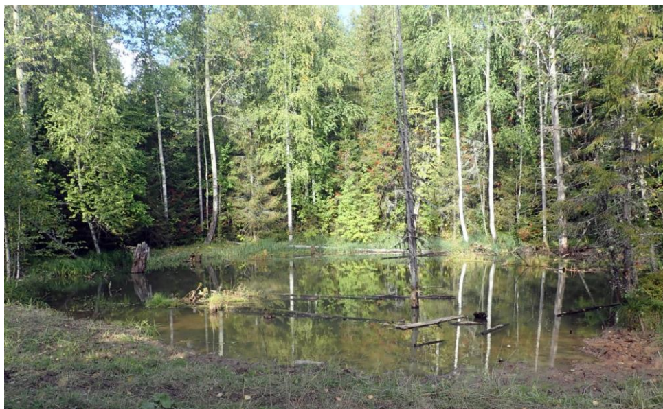
Рис. 1. Карстовые озера севернее с. Верх-Язьва

отложений: голый, задернованный, подэлювиальный, подаллювиальный, подфлювиогляциальный, покрытый, закрытый;