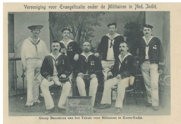
Een groep bezoekers van het Tehuis voor Militairen te Kota Radja, z.d.

In allerhande publicaties van de CMB treffen we vergelijkbare verhalen aan als die van de fuselier die door engelen werd weerhouden om het bordeel te bezoeken. Een ander verhaal vertelt over een vrome militair die het tehuis veelvuldig bezocht om daar op een rustig plekje tot God te bidden om moed voor het overwinnen van zijn angst. In een volgende actie wierp hij zich moedig voorop in de strijd waarin hij werd gedood. 25 De verhalen hadden niet alleen tot doel om op te wekken tot een deugdzaam leven, Bijbellesen en gebed, maar waren eveneens nodig om fondsen te werven om de organisatie draaiende te houden. Naast overheids-