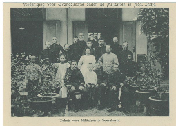
Het tehuis van de Vereeniging voor Evangelisatie onder de Militairen in Ned. Indië in Soerakarta, z.d.

Na het aarzelende begin in 1891, groeide het werk van de Vereeniging snel. Nieuwe evangelist-huisvaders werden uitgezonden en het aantal militaire tehuizen steeg. Ook de inkomsten van de Vereeniging, duizenden gulden werden opgehaald bij Nederlandse burgers, groeiden. Hierdoor konden huisvaders worden aangesteld die zich alléén richtten op de bezoekers van de militaire tehuizen. De groei van het werk betekende wel het verlies van een deel van de oorspronkelijke huiselijkheid. Koffie, thee of sigaren konden door het groeiende aantal bezoekers niet meer gratis worden verstrekt. In 1911, twintig jaar na de oprichting van de Vereeniging, waren