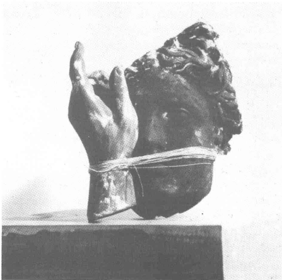
Jannis Kounellis, 1978.

Jannis Kounellis, during seventies and eighties started to use plaster fragments of antique sculptures, often crushed .....and blackened by smoke, than gold instruments ... even the live music of Mozart or Stravinski as congenitive elements of his works and actions. At that time the separation from organic poetics and primal became evident into the substance of his art he sews the metaphysical fibers and becomes indeed "un artista pensante" the spirit of the homeland. Greece, and of Greek myths, evident closeness to alchemy, contemplation, and above all the clear feeling of melancholy - these are all strings which are forming the aura of radically romantic art, in which, the subject of death is existing on all layers.