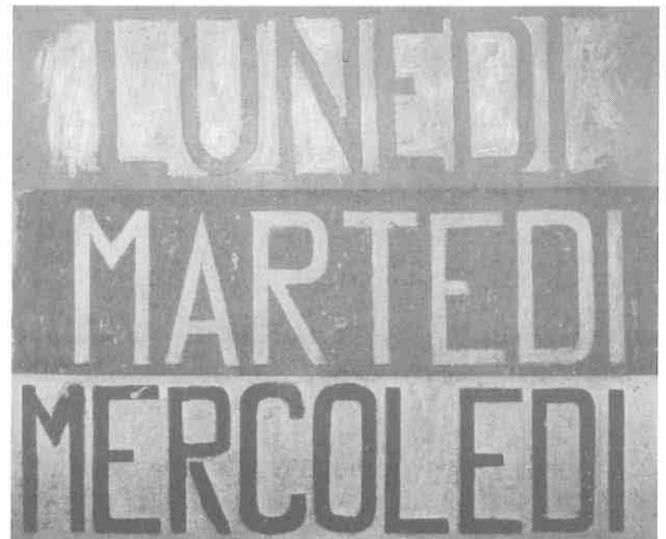
Jannis Kounellis, 1963.