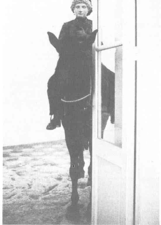
Jannis Kounellis, 1972.

Kounellisova djela iz razdoblja 1967. pa do 1972, dakle, ona koja pripadaju blistavim trenucima arte povera , po mnogočemu bismo mogli promatrati upravo u onom lancu kojemu je informel najbliža karika. Pa ipak postoje i bitne razlike. Ako informel želi da umjetničko djelo kao apsolutna prisutnost bude čitavo od iskustva u činu, kako ga je definirao G.C. Argan, i da je oslobođeno svakog evociranja sjećanja, baš kao i zalaganja za budućnost, tada u Kounellisovim djelima i performansima iz vremena arte povera treba vidjeti i nešto drugo. Njegova prima materia nije sasvim oslobođena dodatnih značenja. Životinje i minerali, pamuk i kosa, vuna i prah kave, zemlja i vatra uključuju u sebe i memoriju. Njegova vatra i prije nego što je vidljiv element, već je simbol. Štoviše, u vatri postaje materia prima čak ideologijom, ideologijom Prometeja (M. Calvesi).