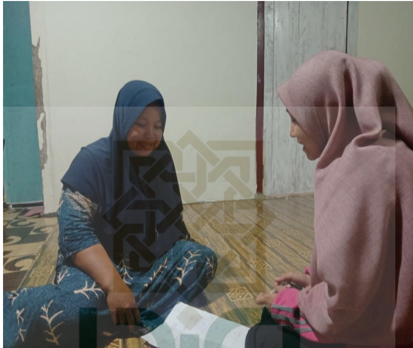
Gambar 6 Wawancara dengan orang tua peserta didik