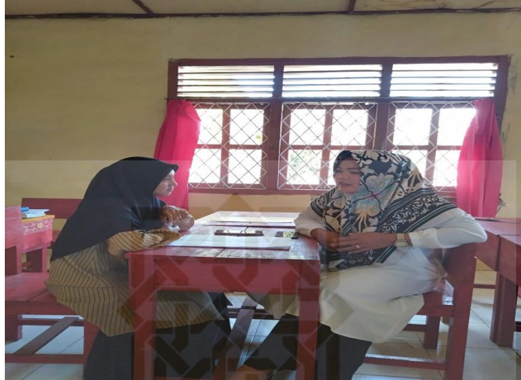
Gambar 4 Wawancara dengan orang tua Peserta didik