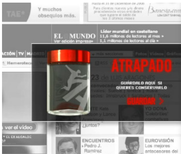
Figura 11. Captura de pantalla y enlace al vídeo del desarrollo del banner .