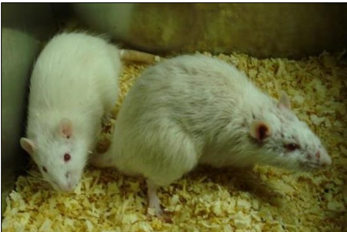
En la imagen se muestran dos ratas con signos clínicos en las que el bienestar se encontraría comprometido. Presencia de lateralización de la cabeza (izquierda) y postura antiálgica conjuntamente con pelo hirsuto y lesiones cutáneas (derecha).