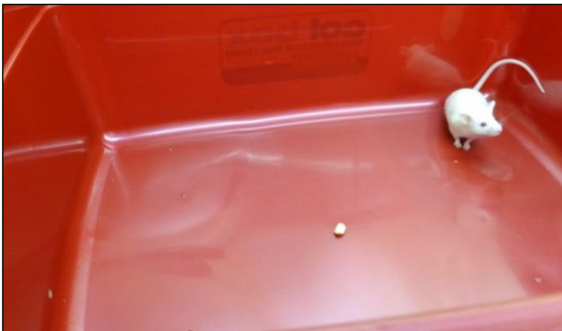
Ratón en una prueba de campo abierto, un tipo de metodología utilizado frecuentemente para analizar ansiedad en roedores de experimentación.

campo abierto, el laberinto en cruz elevado, el test de natación forzado, entre otras, que principalmente se utilizan para estudiar comportamientos asociados a la depresión y la ansiedad (Belzung y Griebel, 2001; Krishnan y Nestler, 2011). Además, se están desarrollando técnicas específicas para evaluar el bienestar animal, tal como la prueba de sesgo cognitivo. Dicha técnica estudia los sesgos en el juicio, en la memoria o en la atención que se desencadenan cuando los animales experimentan un cambio en su estado emocional (Harding y col., 2004; Resasco y col., 2021).