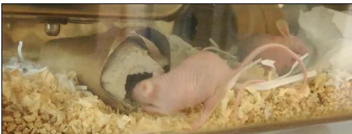
Ratón alojado en una caja enriquecida, interactuando con un elemento cuyo objetivo consistió en promover comportamientos de exploración. Dicho objeto estaba conformado por un tubo de cartón con ambos extremos sellados y relleno de viruta de álamo y almendras picadas. En la imagen se observa un ratón nude escavando en la viruta mientras busca los trozos de almendra mezclados en ella.