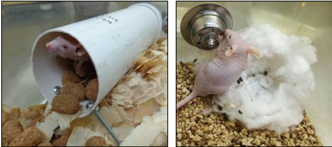
Ejemplificación de dos pruebas comportamentales que se realizan en la caja donde normalmente habitan los ratones y que utilizan comportamientos intrínsecamente motivados. En el “Burrowing Test” (izquierda) se evalúa la motivación para realizar la madriguera y en la evaluación de la calidad de nido (derecha) se califica la complejidad del nido realizado mediante una escala cualitativa.