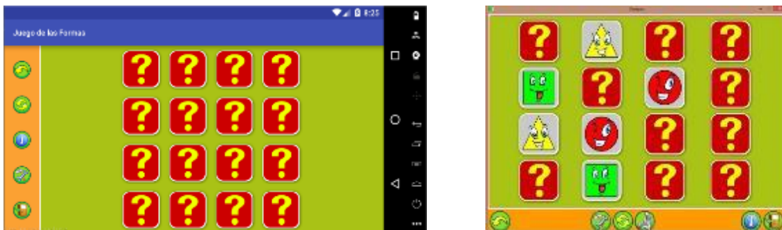
Figura 5. Juego de memoria con formas, tipo Memotest (celular y PC)