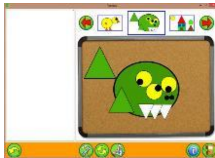
Figura 4. Creando con las formas