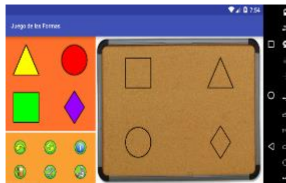
Figura 6. Pantalla Juego de encastre desarrollado en Android para celular o tablet