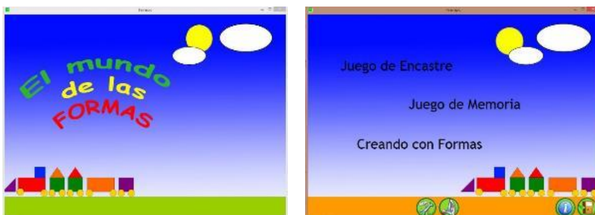
Figura 2. Primeras dos pantallas del Juego “Las formas”

En la etapa actual, y ya con el sistema finalizado en versión PC, de manera robusta y totalmente funcional, e instalándose en las máquinas que se reciclan y entregan a Establecimientos de Educación Especial desde UNITEC, se ha empezado a hacer una reingeniería de la aplicación, traduciendo parte del código fuente y estructurando de manera óptima el nuevo código de programación en ANDROID, a fin de lograr una aplicación especialmente diseñada y optimizada para los teléfonos con pantalla táctil y los dispositivos tablet.