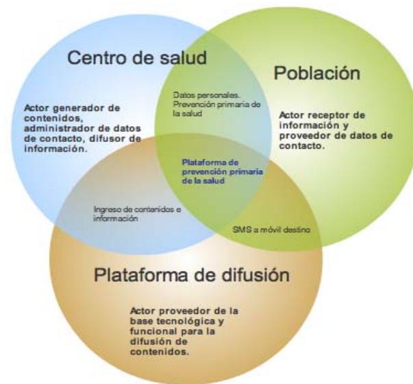
Figura 1: Actores principales del sistema de información y sus relaciones

Los componentes que forman parte de la plataforma se presentan en la Figura 2. Las etapas del flujo de información incluyen la asociación de adherentes a las campañas, la generación / administración de contenidos, el almacenamiento de los mismos y la difusión de la información.