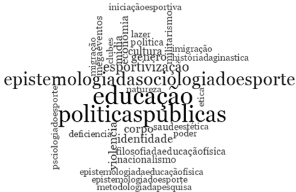
FIGURA 3 Assuntos mais recorrentes nas publicações do JLASST.

três artigos, respectivamente. As demais palavras encontradas na nuvem de palavras se apresentaram apenas em dois ou em uma única publicação do JLASST.