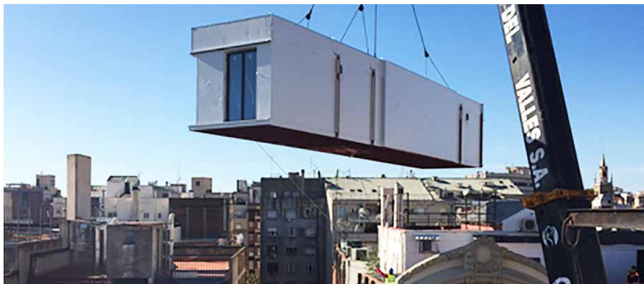
Figura 2: LCT, montaje en Calle Girona 81, Barcelona, 2015.

Estas experiencias han fomentado la aparición de diversos grupos interesados en el tema. Bajo el concepto de “densificación medida y rehabilitación urbana por sobreelevación” (“densification mesurée et réhabilitation urbaine par la surélévation”, ADFA, 2019), la Asociación para el Desarrollo de la Propiedad Aérea (ADFA por sus siglas en francés), propone conquistar, valorizar y desarrollar el espacio aéreo –los techos- en las áreas centrales de las ciudades francesas. Sólo en un estudio realizado por el “Atelier Cantal-Dupart” en 12 calles de París, detectó 466.650 m 2 posibles para el completamiento de viviendas sobre techos, hasta cumplir con los actuales requerimientos de los códigos urbanísticos.