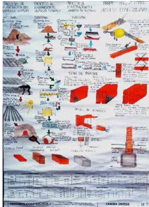
Figura 5: Clase 2 El Proceso Tecnológico, 2019.

En la Clase 2, denominada del Proceso Tecnológico, se trabajó sobre el proceso constructivo del subsistema donde contribuye a conformar elementos de este. Su resolución, la relación con otros materiales, ventajas y desventajas de cada tipo, el proceso constructivo y el operario.