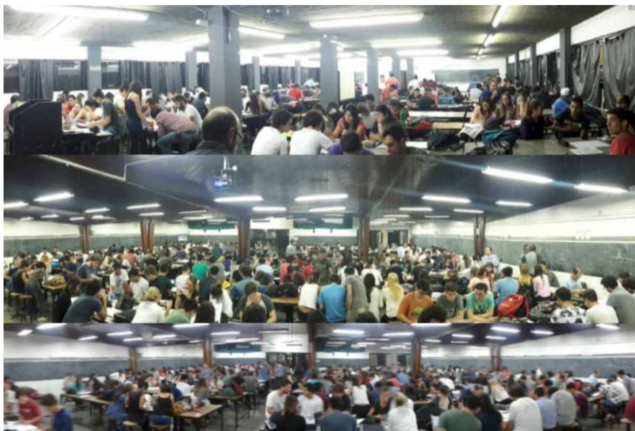
Figura 7: Clase 4 La Integración Vertical, 2019.

La importancia del trabajo en equipo hace a que se organicen y planifique el objetivo modelo planteado.