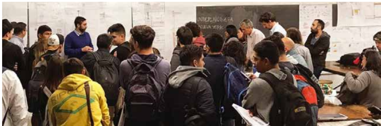
Figura 6: Clase 3 El Desarrollo Sistémico, 2019.

En el estudio del detalle se aportó en el cambio de escala necesario para la comprensión del caso, todos los contenidos particulares del material aprendidos en las clases anteriores.