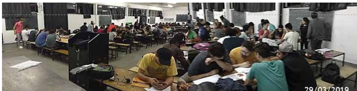
Figura 4: Clase 1 Los antecedentes, 2019.

En las comisiones se trabajó con fichas que guiaban a los alumnos en la indagación de las variables propuestas aplicadas a los subsistemas considerados en el sistema constructivo del ejemplo.