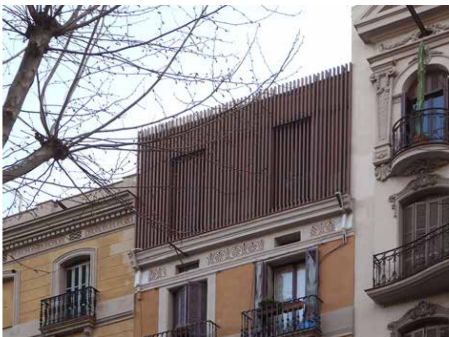
Figura 1: LCT, Calle Girona 81, Barcelona, 2017.

Fundada y dirigida por el arquitecto catalán Joan Artés, “La Casa por el Tejado” (LCT) es una empresa con sede en Barcelona, dedicada a la mejora y completamiento de edificios incorporando áticos nuevos (viviendas sobre terrazas existentes). La metodología planteada por la empresa comprende un complejo proceso que incluye desde la identificación de las oportunidades de construcción por sobreelevación que plantea la ciudad en el ensanche Cerdá (por capacidades urbanísticas remanentes), a la evaluación técnica, económica, dominial y comercial de dichas oportunidades, la compra del espacio aéreo, la restauración y rehabilitación de los edificios existentes, junto con la incorporación de la capacidad constructiva remanente a través de módulos tridimensionales industrializados, que son izados sobre las construcciones existentes.