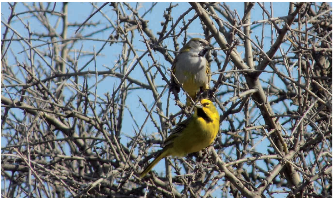
Figura 2. Pareja registrada (1 macho y 1 hembra) el 19/9/17 en el partido de Patagones.