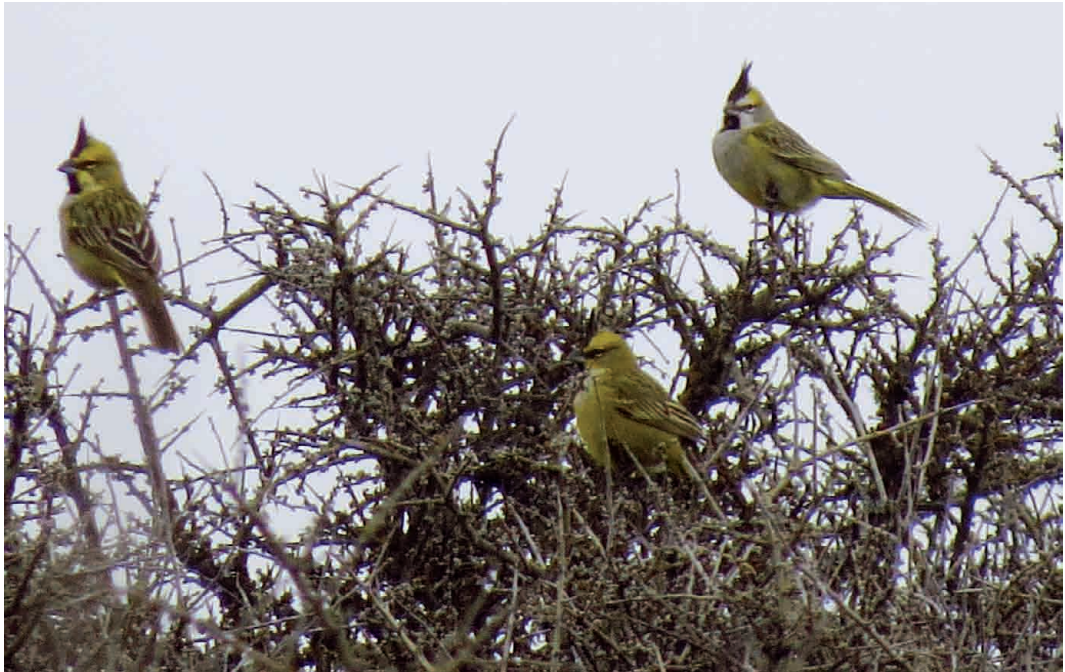
Figura 1. Dos machos y una hembra registrados el 15/10/15 en el partido de Patagones.