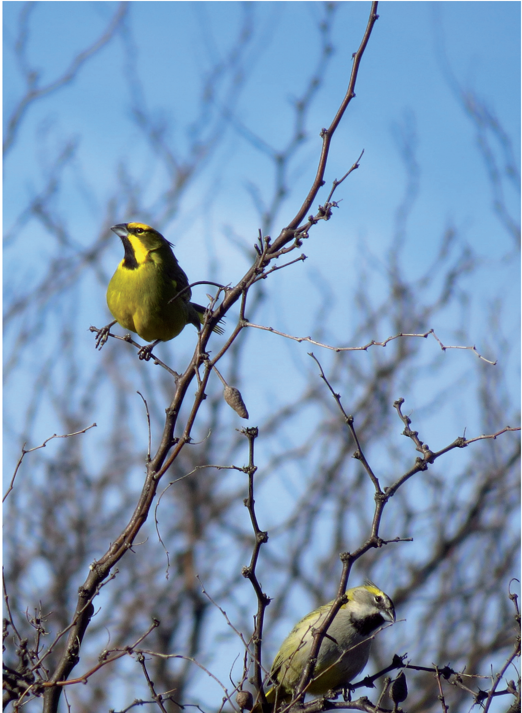
Figura 3. Pareja registrada [1 macho y 1 hembra] el 20/9/17 en la Reserva Chasicó, partido de Villarino.