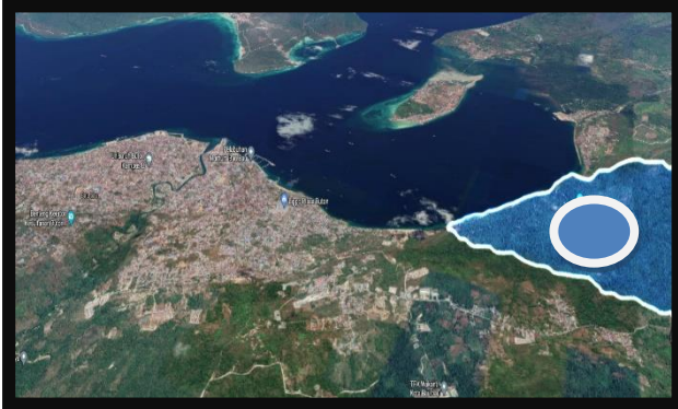
Gambar 1.1 Peta Lokasi Air Terjun Tirta Rimba di Kota Baubau

jangkau oleh wisatawan baik Lokal, Nasional ataupun Mancanegara. Berikut adalah Peta wilayah Air Terjun Tirta Rimba yang menjadi kawasan Sapta pesona di kota Baubau.