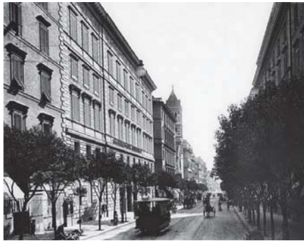
De Via Nazionale rond 1900: moderne architectuur, goede bestrating, straatverlichting, trottoirs met bomen, een tramverbinding en Hotel Quirinale.

tot leven kwamen, terwijl ze elders al ten onder waren gegaan en opgeofferd waren aan de technisch-ökonomische Zweckmäßigkeit des äußeren Lebens . a