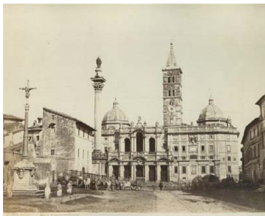
Giorgio Sommer, Santa Maria Maggiore, tussen 1860 en 1875.

dus anders was dan die van de nostalgische reactionair Bachofen. Jacob Burckhardt wilde, door partijgangerschap voor het schone, het beste uit de cultuur van het oude Europa uit de klauwen redden van de moderne tijd. Door het te koesteren hoopte hij bij de eventuele wederopbouw na de catastrofe behulpzaam te kunnen zijn. Hij opteerde voor de zelfopgelegde plicht om alles van waarde uit het Italiaanse verleden door de crisis van de moderne tijd heen te slepen. In het volle besef dat de weg terug naar dat mooie premoderne verleden voor altijd was afgesloten. Burckhardt gaf zich in Italië (en hierbinnen Rome meer nog wel dan Florence) over aan de contemplatie over het beste uit de Europese traditie, omdat hij zich geroepen voelde dit omhoog te houden en als tegenbeeld te plaatsen tegenover de verderfelijke moderne wereld. a De moderne mens werd door een storm voortgeblazen, die zijn macht verre te boven ging. Hij gaf zich over aan ronkend objectivistisch nationalistisch vooruitgangsvertrouwen. De moderne wereld was het contact met het verleden verloren. Dit schreeuwde om een reactie: schatbewaarderschap dat de ware cultuur veilig stelde en doorgaf aan toekomstige generaties. b