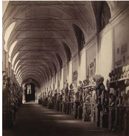
Robert MacPherson. Rome, Chiaramonti Museum (Vaticaanse collectie). Datum onbekend.

van de vele zinledige gebeurtenissen van vroeger. a Deze meer 'nationaal-liberale' manier van denken zou alleen maar aan kracht gaan winnen. b