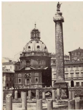
Giorgio Sommer, Forum van Trajanus. Albumen zilver print. 1858 – 1860.