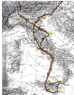
Johann Gottfried Seume en zijn wandelroute door Italië (1801-1812).