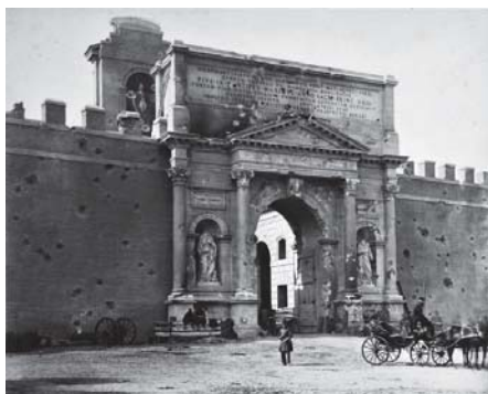
De Porta Pia, vlak na de inname van Rome op 20 september 1870. Duidelijk zijn kanonskogelinslagen te zien.

Cavour was inmiddels overleden. Hij werd opgevolgd door minister-presidenten zoals Ricasoli, Rattazzi, Farini, Minghetti en La Marmora, die zich voor de lastige taak gesteld zagen om de eenwording te voltooien en de problemen Oostenrijks-Venetië en Rome op te lossen. Het waren opnieuw oorlogen in combinatie met diplomatie die de doorslag gaven. In 1866 vocht Italië tegen Oostenrijk mee aan Pruisische zijde. Er werd bij Custoza verloren en op zee bij Lissa. Garibaldi's hernieuwde pogingen om Rome in te nemen leidden bij Mentana eveneens tot een nederlaag, nu tegen Frans-pauselijke troepen. Maar uiteindelijk leverden de tactische en operationele nederlagen toch strategische en politieke overwinningen op, zoals vaker in de militaire geschiedenis. Na het verlies van de Oostenrijkers tegen Pruisen bij Königgrätz in juli 1866 sleepte Italië bij de vredesonderhandelingen Venetië binnen. Toen de Fransen in 1870 op hun beurt werden verpletterd door de Pruisen, werd de inname van Rome mogelijk. De Franse regimenten vertrokken uit Rome. Daarna werd de eeuwige stad na korte schermutselingen door de Italianen op 20 september veroverd. De Bersaglieri van Cadorna sloegen een bres in de stadmuuren bij de Porta Pia. De pauselijke troepen boden symbolisch verzet. De inname was een futiliteit.