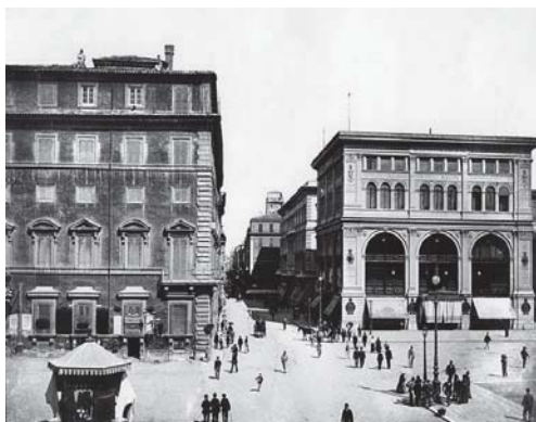
Rome, Via del Corso, rond 1885-1890?

Rome werd hierom gezien als de bevelking van iets hogers en heiligs door een lagere platte wereld. Historisch gezien was de eenwording van Italië volstrekt legitiem voor Gregorovius. a Maar met de concrete gevolgen ervan in Rome wenste hij niet geconfronteerd te worden. b