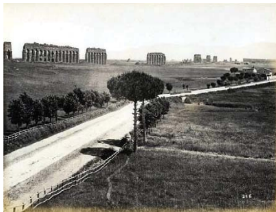
James Anderson. Via Appia Nuova en aquaduct van Claudius. Rome. Circa 1860-70. Anderson-catalogusnummer 216. Wikimedia Commons.

Toch was Bachofen ook somber over de mogelijkheid om terug te keren naar de oude eerbiedwaardige en sober-vrome levenshouding van de vroegste Romeinen. Hij beseftte terdege dat het paradijselijke verleden door een diepe kloof gescheiden was van het vermaledijde heden, en ook zeer wezenlijk verschillend was van dat heden. Van toepasbare lessen of kopieerbare modellen was dan ook geen sprake, vanwege de onvergelykbaarheid van de verschillende historische periodes. Bachofen ontkende zelfs ten stelligste dat hij met zijn tekst invloed zou hebben willen uitoefenen op de politiek van zijn tijd, of de oudheid politiek wilde instrumentaliseren. Bachofen stelde helemaal geen redding te verwachten door zijn essays. Ze leverden volgens hem slechts het genot op van inzicht. Hij zag voor 'de besten' van zijn tijd slechts een rol weggelegd binnen de contemplatieve 'terugtocht' in de historische wetenschap. Zij moesten in Zurückgezogenheit zich maar troosten met de elegische stemming, die voortkwam uit kennis. d