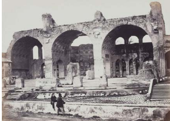
Fotograaf en jaartal onbekend. Toeristen bij de Basilica di Costantino.

af van de eigen radicale, universalistische links-liberale wortels. Het legde de nadruk meer op een historisch ontwikkelingsproces in het verleden, met de ontplooiing van idealen en machten in het centrum van de aandacht. Zij zouden zich erin verwezenlijken, in samenspraak met politieke machthebbers en gevoed door de maatschappelijk-culturele elite. Juist de liberalen, sterker dan de conservatieven, die kritisch bleven op de politieke ontwikkelingen in het contemporaine Italië, keken in Italië graag weg van de actualiteit en zochten naar kernpunten en keerpunten van een idealistische (voor)geschiedenis. Men richtte zich in Italië sterker dan voorheen op de (kunst)geschiedenis en getroostte zich in Italië veel moeite om het liberale en moderne dat er nauwelijks te negeren was, niet te hoeven zien.