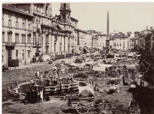
Giorgio Sommer, Piazza Navona. Albumen zilver print. Circa 1860-70. Een beeld van het premoderne Rome. Piazza Navona vol karren en afval. In de ogen van veel vroege liberalen en aanhangers van het Junge Deutschland behoorde dit geen kristallisatiepunt te zijn voor nostalgisch en escapistisch terugverlangen. Hier paste kritiek.

Het boeiende van deze politiek radicalere reizigers uit de generatie na Stein is geweest dat zij het kritische en politiek radicale engagement uit de traditie van Fernow, Seume en Stein wisten te koppelen aan de idealiserende en poëtiserende constructies zoals de Klassik en de Romantik die hadden opgeleverd. Ze leverden in de Biedermeier -tijd een fascinerend soort dubbelslag, die in afgezwakte vorm doorwerkte in de latere dominante liberale omgang met Italië en zijn verleden. Hier ging opeens (romantische) idealisering van Italië samen met de strijd tegen concrete misstanden in het contemporaine Italië, en Duitsland. Hier werden escapisme en politieke woede op een wijze samengebracht die nog niet eerder was voorgekomen. Een sterk gepoëtiseerd Italiaans verleden wisten zij voor de politieke problemen in het heden relevantie te geven. Wilhelm Müller zowel als Heinrich Heine, prikte daarbij ook nog eens op ironische wijze door de (eigen) geëngageerde beeldspraak heen. Dat zou na hen helaas niet vaak meer gebeuren.