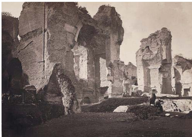
Gioacchino Altobelli, Ruïnes van de Thermen van Caracalla. Circa 1870?

Linksom of rechtsom, politieke visies sijpelden dus door in de Italië-ervaringen. Unpolitische reizigers én politiek geëngageerde reizigers koppelden beide politieke uitgangspunten en oordelen aan Italië, haar volk en haar monumenten.