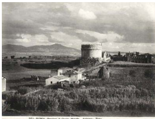
James Anderson, De 'historische' Campagna. Het grafmonument van Cecilia Metella aan de Via Appia. Anderson-catalogusnummer 523. Wikimedia Commons.

Een kenmerkende passage uit Rom, Römer, Römerinnen is de beschrijving van de Campagna di Roma. Daarin valt, naast de romantische plichtplegingen, vooral veel 'realistische' kritiek op. Na het gejubel om de mooie natuur, volgde een harde schets van het ondraaglijke leven van de dagloners en hun armoede. 59