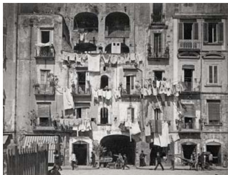
Giorgio Sommer, Napels. Circa 1880. Het pittoreske volkse en vies-ruige Italië, dat de massatoerist uit de twintigste eeuw zo waarden ging, was de liberaal-burgerlijke Duitse reiziger uit de negentiende eeuw vaak een gruwel.

Het vreemde feit doet zich daarmee voor dat zeer vooruitstrevende liberalen zoals Förster de praktisch-politieke kant van het heden en verleden in Italië als 'oppervlakkig' in geschiedfilosofische zin naar de achtergrond schoven en hun aandacht vooral richtten op wereldhistorische ideeën, personen en machten. Deze 'idealistische' manier van redeneren zou sterker worden binnen het Duitse liberalisme. Op het politieke handwerk en de dagelijkse actualiteit, het 'moment-gebundene' in heden en verleden, ging men, zeker in de generatie na Förster, neerzien. Het werd iets waarvan men eigenlijk behoorde weg te kijken. Wat erg opmerkelijk genoemd mag worden voor 'liberalen'.