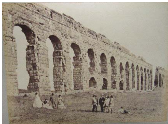
Altobelli en Molins, Acqua Claudia. Rond 1870? Toeristen in de Campagna. Omgeving Rome, nabij de Via Appia.

Daarbij blijkt direct dat die politieke kleuring (of die nu expliciet geuit werd of impliciet bleef) op heel verrassende en interessante plaatsen naar voren kwam. Het waren heel geregeld de plaatsen waar men juist dacht niet aan politiek te doen. Een droog-feitelijke constatering over een klassiek beeld, een meisje bij een bron, een volksfeest, afkeer van het moderne Rome na 1870, een wandeling langs de Via Appia, het had in de negentiende eeuw ook vaak een politieke connotatie, al was het maar omdat het eigenlijke achterliggende thema bijvoorbeeld vrijheid was. Men zou misschien zelfs wel kunnen volhouden dat veel (politieke) meningsverschillen over de Duitse samenleving in debatten over het geësthetiseerde en gemusealiseerde Italië werden uitgevochten. Rome lijkt waarschijnlijk óók te hebben gefunctioneerd als een soort politiek-intellectuele bliksemafleider.