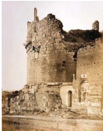
Robert MacPherson. Rome, Via Appia. Mausoleum van Cecilia Metella. Vóór 1872 (overlijdensjaar van de fotograaf).

verstopt) duidelijk terug in zijn omgang met het (antieke) verleden. De Römische Geschichte is het werk waarin voor de goede verstaande de politieke denkbeelden duidelijk naar voren kwamen. 156 De Römische Geschichte bood een liberaal-burgerlijke visie op het verleden, waarin een ruime plaats was toegemeten aan de ontplooiing van de antieke Italiaanse natie en de grote rol van de leidinggevende elite daarbij, o.a. vanwege hun vermogen 'ideaal' te denken en handelen. 157 De Römische Geschichte raakte door een mengeling van 'realistische' beschrijvingen van antieke worstelingen met 'nationaal-politieke' vraagstukken in combinatie met nauwelijke verholen referenties aan het heden het hart van de Duitse burgerlijk-liberale wereld. Het feit dat Mommsen heden en verleden hier (soms) op elkaar betrok, verklaart waarschijnlijk mede de enorme populariteit van het boek (afgezien nog van de zeer grote wetenschappelijke en literaire merites). Mommsen was zich hierbij als geen ander bewust van de grote verschillen tussen verleden en heden. Maar de lotgevallen van de Romeinse Republiek boden toch naar zijn mening ook stof ter reflectie en hadden actualiteitswaarde. Ook in de Romeinse geschiedenis hadden 'nationaal' eenheidsstreven, burgerrecht, staatsvorming, zelfbestuur, moreel-zedelijk leiderschap, militaire macht en 'parlementaire' vertegenwoordiging zich in wisselwerking verwezenlijkt. a