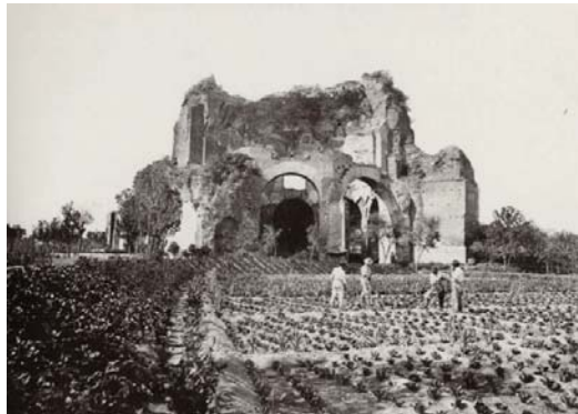
Altobelli en Molins, De ruïne van de zogenaamde tempel van Minerva, met tuinbouw rondom. Datum onbekend.

Voor de stad Rome betekende dit dat men er zich tot 1870 kon wanen in een stad waarin de tijd had stilgestaan. De stad leek wel onttrokken aan de moderne tijd, die de wacht was aangezegd. Rome was een onmoderne en uitgesproken lege stad, met grote delen die onbewoond waren. De helft van de stad binnen de Aureliaanse muur lag braak. De stad was groen en open. De Campagna liep de stad in. Industrie was er niet of nauwelijks. Er werd aan wijnbouw en veeteelt gedaan, ook binnen de stadsmuren. Rome had ondanks alle antieke reminiscenties eigenlijk het karakter behouden van een middeleeuwse stad, waarover een barok raster was gedrapeerd van inmiddels vervallen en gedeeltelijk overgroeide straten, pleinen, kerken, fonteinen en palazzi. Archeologische sites waren veel minder dominant aanwezig dan men geneigd is te denken. Het Forum Romanum, het Colosseum en de Palatinus waren nog niet uitgegraven. Kerken, kloosters en koepels overheersten het stadsbeeld. 174