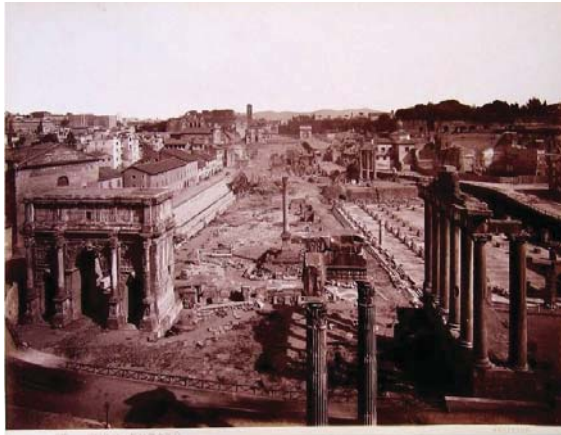
James Anderson, Forum Romanum n. 325. Vóór 1877 (?).

De Römische Geschichte was daarmee zonder meer een boek van een liberale activist, die de vragen naar de in zijn ogen juiste verhouding tussen natie, volk, burgers, elite, militairen, macht, recht, staat en cultuur, in een historisch betoog verpakte. Mommsen schetste een geschiedbeeld waarin waarschuwingen en oproepen zaten, die op de eigen tijd terugslagen, zonder heel plat exemplarisch te worden. Zijn werk vond enorme weerklink, omdat de 'dode' geschiedenis er zo met 'hete' politieke Leidenschaft werd doorwasemd. Naast de Lutherbijbel stond Mommsens meesterwerk bij de meeste huishoudens uit de gegoede burgerij op de boekenplank. Het Duitse burgerdom van de jaren zestig en zeventig van de negentiende eeuw kreeg een nieuw oudheidbeeld aangereikt, waarin het zichzelf en de eigen problemen c.q. idealen terugvond. a