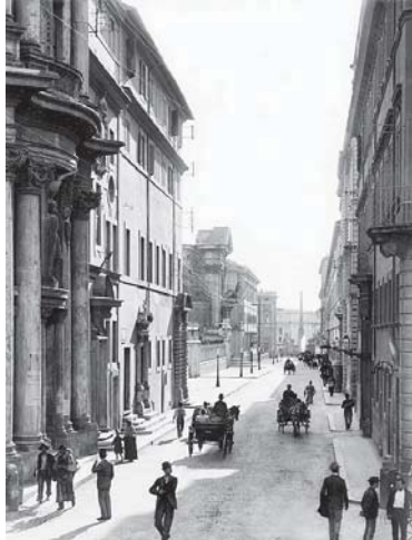
Rome. Via XX Settembre, 1898.