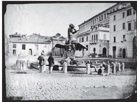
Fotograaf onbekend, Piazza Barberini. Rond 1890? Visioen van het oude Rome, Roma Sparita.