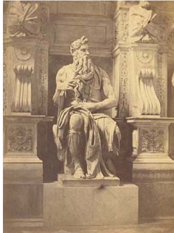
De Gewaltmensch ? De Mozes van Michelangelo in de San Pietro in Vincoli in Rome. Studio Fratelli D'Alessandri, 1860. Bron: Wikimedia Commons.

Burckhardt wilde de moderne mens aansporen tot een: eigenen Aneignung des Vergangenen , vanuit een conservatief en cultuurpessimistisch soort Bildungs-ideaal . a