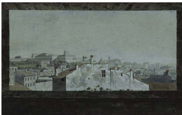
K. F. Schinkel, blik op het Quirinaal, vanuit Schinkels woning in Rome. 1803-04. Staatliche Museen zu Berlin, Kupferstichkabinett.

Verbaast het dat de politieke actualiteit in Italië bijkans niet te vermijden was voor de Duitse reizigers? Dat kon vervolgens twee kanten op. De extreme politieke verwickelingen rond 1800 stimuleerden bij sommigen overduidelijk een vorm van wegstappen van de daadwerkelijke Italiaanse actualiteit en de problemen ervan. Het kan het escapisme van sommige reizigers goed verklaren. Het kon omgekeerd juist ook leiden tot de aanscherping van de politieke betrokkenheid. 24