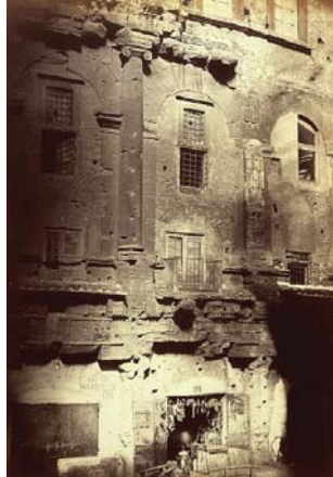
Robert MacPherson, Theater van Marcellus vanaf Piazza Montanara. Rome. Circa 1858.

flammende Riesin uiteindelijk niet te stoppen was. 9