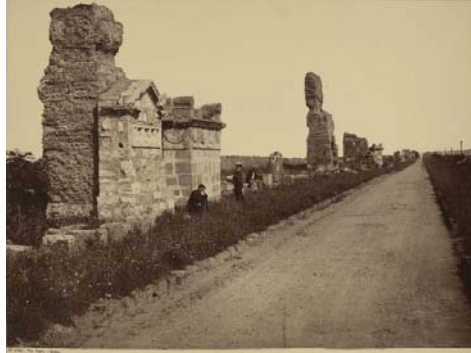
Giorgio Sommer, Via Appia. Rond 1860? Catalogusnummer: 4235.

Geisterschritt , als geestverschijningen. Te midden van deze Geisterstille , slechts onderbroken door het ave van de klokken, trok iedereen naar Rome. Ook de 'ik' uit het gedicht vond er zijn Heim , waar alles ondergang en melancholie ademde. De Pinienbaum , de zwanen, de klokken, de laatste zonnestralen op de Via Appia , het door bloemen overgroeide marmeren beeld, zij bezongen allen: eine schöne versunkene Welt . 9