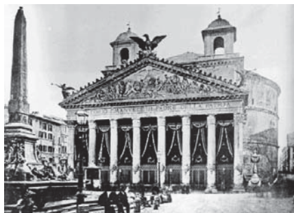
Het Pantheon (formeel de Santa Maria ad Martyres) in gereedheid gebracht voor de begrafenis van koning Victor Emanuel II in 1878. Het fries vermeldt: Padre della Patria . Sindsdien werden in principe alle Italiaanse koningen hier begraven.

De spanning binnen Rome was ondertussen om te snijden. Het was eigenlijk onvoorstelbaar: de paus was beroofd van zijn totale Patrimonium Petri en wereldlijke macht. De botsing erna tussen het pausdom in Rome en de Italiaanse staat c.q. het Romeinse gemeentebestuur (dat overigens niet altijd radicaal-liberaal was) was ongemeen hard. De paus werd 'de gevangene van het Vaticaan' (tot de akkoorden van 1929). Pius IX excommuniceerde op zijn beurt vervolgens velen die de kant kozen van 'Italië' in plaats van 'Rome'. Van pogingen tot dialoog en consensus was nauwelijks iets te merken. De Romeinse adel raakte verdeeld tussen 'roden en zwarten'. De conservatieven, de zwarte adel en de paus eisten niets minder dan volledig herstel van de pauselijke macht en waardigheid. De liberale nationalisten weigerden dat categorisch. Dat in 1878 zowel koning Victor Emanuel II als paus Pius IX overleden, leidde niet direct tot verbetering van de situatie. 176 De begrafenissen spreken boekdelen over de stemming in Rome. De koning werd in het Pantheon bijgezet als een nationale held (overigens tegen zijn zin, omdat hij zelf de voorkeur gaf aan het familiegraf in Turijn). Het ging gepaard met veel nationalistische retoriek, waarbij de kerk (want dat was het Pantheon inmiddels) tot nationaal mausoleum werd omgebouwd. Paus Pius IX werd bijgezet in de San Lorenzo, buiten de muren van de stad. Zijn lijk werd door een boze menigte bijna in de Tiber geworpen. 177