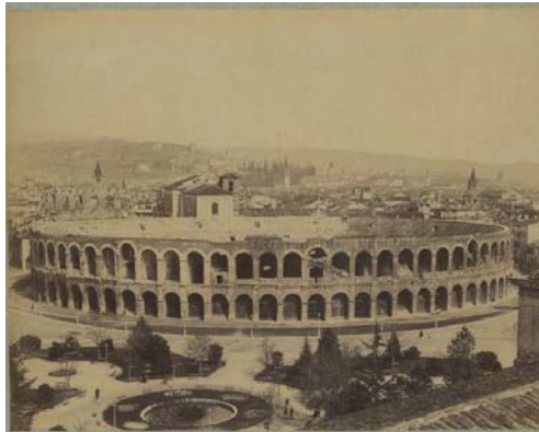
Fotograaf onbekend, het amfitheater van Verona. Rond 1890?

latere keizers. a De boodschap was uiteindelijk: ook toen, in de oudheid, was er een strijd gaande tussen vooruitganggezinden aan de ene kant en aan de andere kant machtswellustelingen die belangen aanzagen voor ideeën, net zoals nu. Heine werd niet voor niets wreed gewekt uit zijn 'historische droom' in het amfitheater van Verona, door klokken die opriepen tot gebed. Hij werd vanuit het verleden wreed teruggeplaatst in het repressieve christelijk-Oostenrijkse heden. b