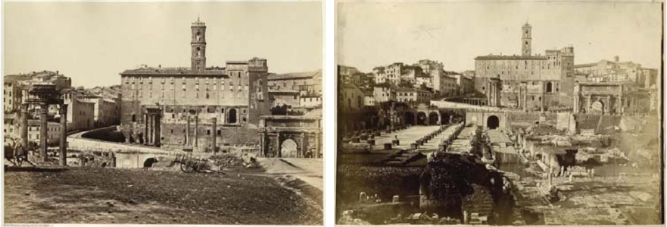
Het oude versus het nieuwe Rome. Links: het Forum Romanum (nog onuitgegraven), in de richting van het Capitool, 1854. Toegeschreven aan James Anderson. Rijksmuseum, Rijksprentenkabinet, Amsterdam (foto RP-F-F80035). Rechts: Gezicht op het (inmiddels uitgegraven) Forum Romanum te Rome, ca. 1875. Toegeschreven aan Gioacchino Altobelli en Pompeo Molins. Rijksmuseum, Rijksprentenkabinet, Amsterdam (foto RP-F-00-267).

noch unsichtbar, magisch die Gewalt, die er einst durch Wort und Harmonie geübt. Keinen geeigneteren Ort konnte er aufsuchen als diesen, groß genug zur Aufnahme aller gebrochenen Existenzen und Hoffnungen der Erde; wo die Natur, die Kunst, die Religion und das Schauspiel tausendjähriger Geschichte überreichen Trost bietet für alle Schmerzen der Erde; wo das Größte, was die Erde hatte, begraben ist, wo die Zeit mit ihren Zerstörungen und die Ewigkeit zugleich ihren Triumphzug zu halten scheint (Carl Justi, Briefe aus Italien (Bonn 1925; 2-e opl) 12 januari 1868).