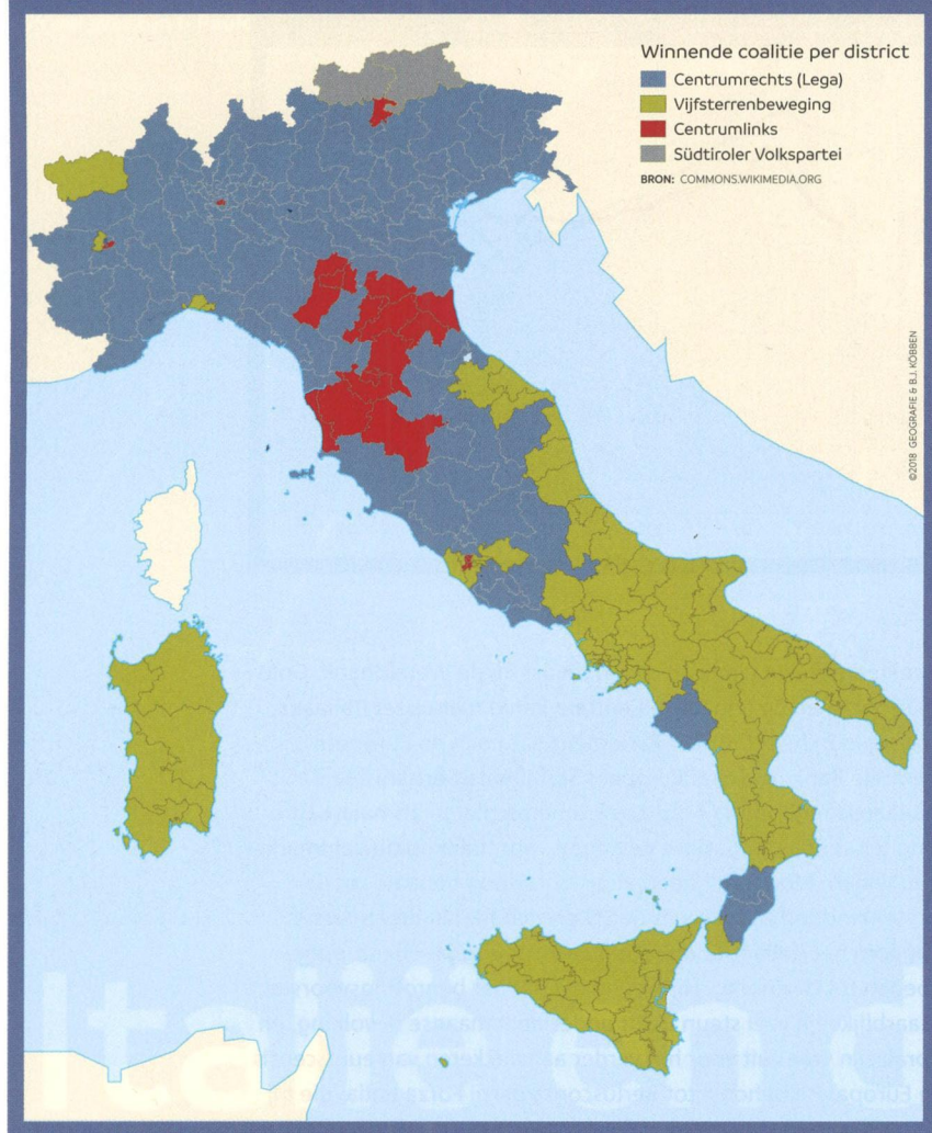
Figuur 2: Winnende coalitie per kiesdistrict (maart 2018)

voor populisme. De eerste golf werd ingeleid door de Lega Nord, een beweging van lokale kernen van activisten in Noord-Italië, die zich aanvankelijk sterk maakte voor directe inspraak in lokale en regionale besturen en zich afzette tegen de grote sociale uitgaven in Zuid-Italië. Ook speelde het idee van meer autonomie en mogelijk afscheiding in een eigen staat Padania. Umberto Bossi was lange tijd de leider. Vanaf 2004 trad een andere populist op de voorgrond: Silvio Berlusconi, vastgoeden mediatycoon, bezitter van commerciële televisiekanalen en eigenaar van de voetbalclub AC Milan. Met zijn beweging Forza Italia en het volle gewicht van zijn eigen media wist hij de Italiaanse politiek stormenderhand te veroveren na de herziening van het kiesstelsel in 1994.