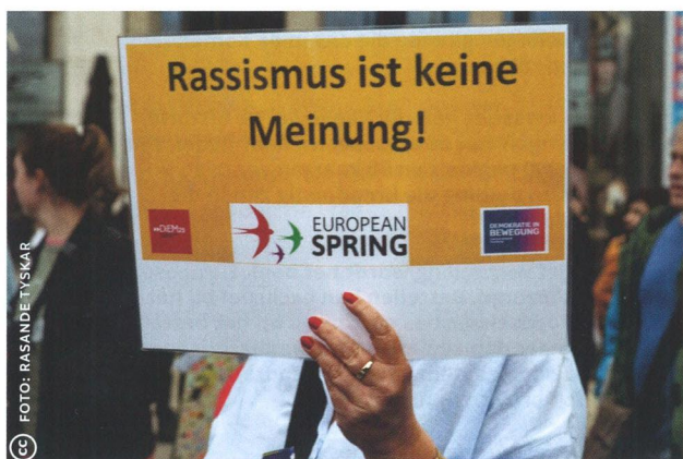
Demonstratie in Hamburg op 29 september 2018 van 30.000 gelijkgestemde geesten waaronder Europese Lente die elkaar – in aanloop naar de EP-verkiezingen – vinden in een veelheid aan doelen zoals democratie, solidariteit, eenheid, respect en gelijke rechten, tegen racisme, rechts populisme en asociaal beleid, uitzetting en exclusie.

Er zijn nog meer verschillen. Lente koerst niet op versterking van het EU-bestuur, maar op democratisering ervan. Volt staat een federale structuur voor ogen, maar is beknopt over de invoering ervan. De beweging vreest het populistische antwoord op de