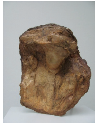
Medardo Rosso – Femme à la voilette

In 2014 ging er veel media-aandacht naar de aankoop van het beeldhouwwerk Femme à la voilette van Medardo Rosso door Museum Boijmans Van Beuningen, dat subsidie ontvangt van de gemeente Rotterdam. De aankoop was bijzonder, omdat het museum met de verkoper een prijs in dollars was overeengekomen en daarbij had bedongen dat het een half jaar de tijd kreeg om geldschieters te vinden. Om te voorkomen dat het museum een financieel risico zou lopen, doordat de dollarkoers in de tussentijd kon stijgen, besloot het een optie te kopen om dit risico af te dekken. Daarvoor betaalde het museum € 22.000. Het museum slaagde erin geldschieters te vinden en bleek vervolgens een gelukkige keuze te hebben gemaakt door de optie te kopen: die was op dat moment € 123.000 waard. De winst werd gebruikt voor de financiering van de sculptuur.