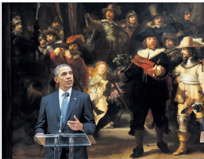
President Obama spoke Monday at the Rijksmuseum in Amsterdam in front of the Rembrandt painting "The Night Watch."

It was nearly five years ago any doubts were laid to rest by engineers at General Motors about a dangerous and faulty ignition switch. At a meeting on Oct. 15, 2009, they learned that in the black boxes of Chevrolet Cobalts confirmed a potentially fatal defect existed in hundreds of thousands of cars. In the months and years that followed, as a trove of internal documents and studies emerged, G.M. told the families of accident victims and other customers that it did not have enough evidence of any defect in its cars, interviews, letters and internal documents show. Last month, G.M. recalled 1.6 million Buicks and other small cars, saying that if the switch was bumped or vibrated down it could shut off