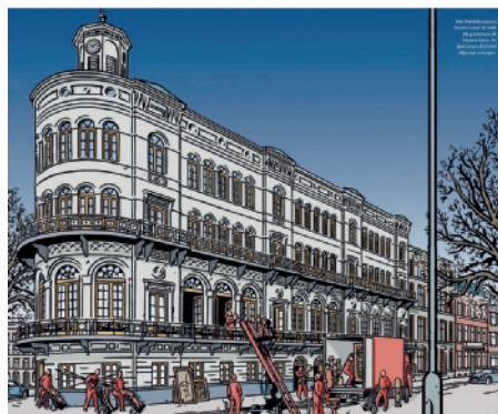
Het Financieele Dagblad publiceert in november 2016 uitgebreid over de ‘redding’ van het Wereldmuseum.

In 2016 grijpt de gemeente Rotterdam alsnog in. Door aanvullende subsidie te verstrekken, garandeert ze het voortbestaan van het Wereldmuseum – in elk geval voor de komende subsidieperiode. De raad van toezicht laat weten dat de directeur “in goed overleg” heeft besloten zijn werkzaamheden als directeur neer te leggen. 14 Onder leiding van een interim-directeur krijgt het museum de kans om de ‘ondernemerschapsaffaire’ van zich af te schudden.