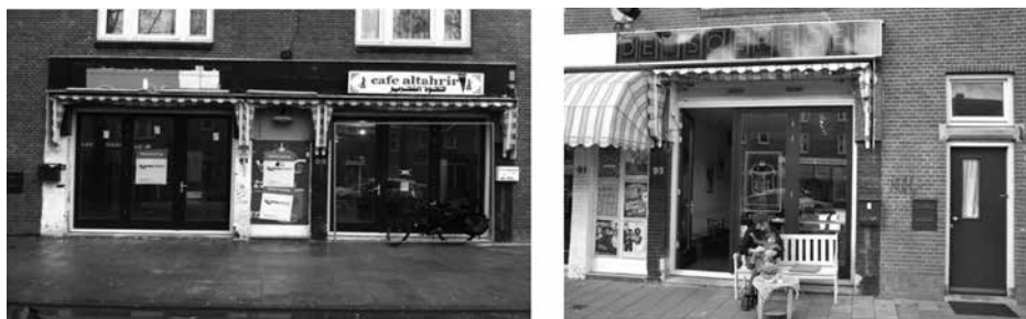
Figuur 2. Commerciële transformatie in de Van der Pekstraat

Deze voorbeelden laten zien hoe culturele initiatieven en voorzieningen gericht op de middenklasse ingezet worden om de buurt te veranderen. We spreken daarbij van kwartiermaken, omdat die initiatieven niet simpelweg het gevolg zijn van een veranderde vraag, maar juist tot doel hebben die vraag te creëren. Daarbij wordt gebruikgemaakt van een discours waarbij de buurt voorgesteld wordt als ‘onontgonnen’ gebied dat in afwachting is van de komst van de middenklasse en hun specifieke consumptiepatronen. Over het algemeen is daarbij geen sprake van kwade bedoelingen bij de ondernemers, kunstenaars of nieuwe bewoners. Sociale en etnische diversiteit wordt gewaardeerd en sommige middenklasse-nieuwkomers maken zich zorgen over te ver doorgevoerde gentrificatie (cf. Tissot, 2014). Desalniettemin zijn ze dominant aanwezig op buurtactiviteiten en dragen ze een beeld uit van wat de buurt en Amsterdam Noord in bredere zin zouden moeten zijn dat nauw aansluit bij de visie van lokale bestuurders.