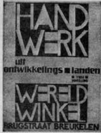
Afh. van de Derde Wereldwinkel in Breukelen.