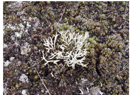
Nieuwe vestiging van het korstmos ezelspootje op de moslaag

centimeter met een oude B-horizont op de overgang met het onderliggende dekzand. Deze werkte isolerend zodat een meer extreem microklimaat ontstond. In dit milieu groeiden vooral zandstruisgras en het pioniermos ruig haarmos. In 2008 bedekten zandstruisgras en/of bochtige smele in de omgeving van de veldjes 70% van het bodemoppervlak met een gemiddelde pluimhoogte van 60 centimeter. De bodemontwikkeling bleek evenredig te zijn met het dichter worden van de plantengroei van vaatplanten en mossen. Als het dekzand plaatselijk wat vochtiger was en veel humus en wortels bevatte, dan groeiden er zandstruisgras en veel grijs kronkelsteeltje (veldje III en IV).