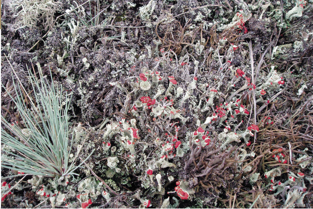
Korstmossenrijke buntgrassteppe op het Deelensche zand

De kans op falen neemt echter toe naarmate de bodem meer organische stof bevat. Bij sterk organische bodems slaat grijs kronkelsteeltje direct toe, met daarna mogelijk ook meer opslag van vliegdennen. Om in sterk vergraste kapvlakten weer vroegere successiestadia met een hogere biodiversiteit terug te krijgen, heeft kleinschalig plaggen de voorkeur. Dit is de enige manier om korstmossen uit zandige pionierstadia zoals stuifzandkorrelloof terug te krijgen. Bij dit kleinschalige patroonbeheer worden de karakteristieke faunasoorten nauwelijks bedreigd en blijven op korte afstand voorkomen.