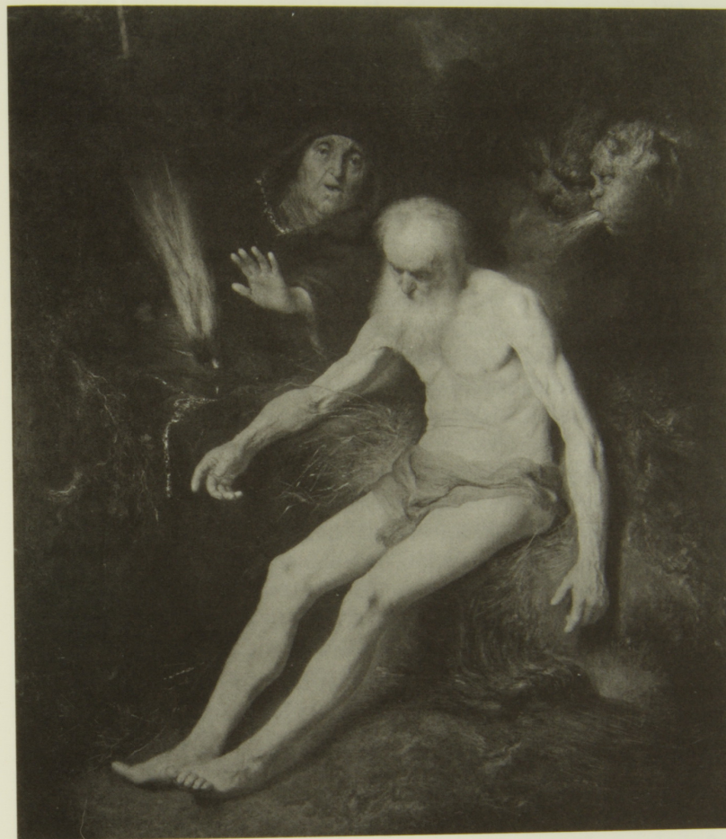
7 Jan Lievens, Job op de mestvaalt , 1631. Doek; 170 × 145 cm. Ottawa, National Gallery of Canada (inv. nr. 4093)