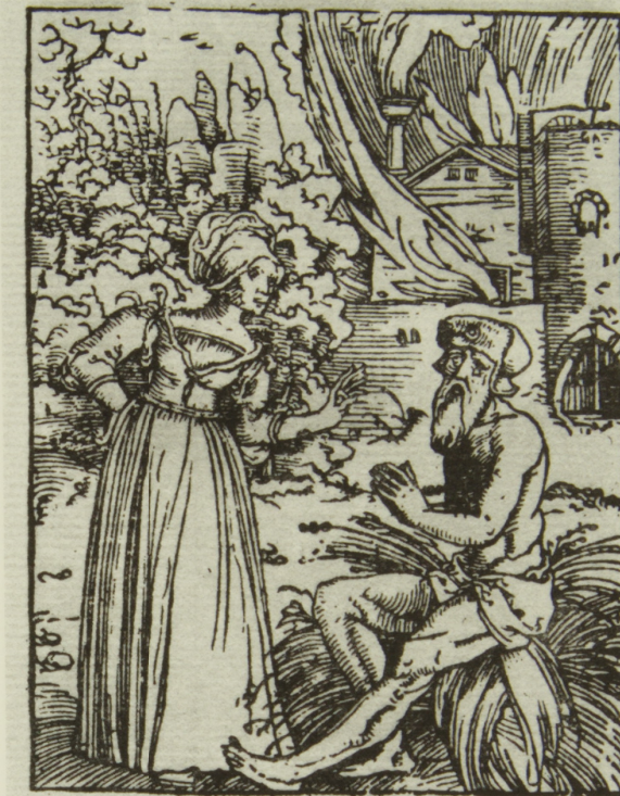
6 Jan Swart, Job op de mestvaalt , illustratie bij het boek Job in De Bijbel , Antwerpen 1528 (Willem Vorsterman). Houtsnede

Een zeer hypothetische mogelijkheid die ik zelfs open zou willen houden, is dat Rembrandt in eerste instantie niet een Jeremia schilderde, maar aanvankelijk een Job op de mestvaalt had gepland. Er bestond immers in zestiende-eeuwse Bijbel-illustraties, in zowel Nederlandse, Duitse als Franse houtsneden, al een picturale traditie van een betreurenswaardige figuur met naast zich een uitslaande brand, en wel in het verhaal Job wiens huis en bezittingen verloren gaan (bijvoorbeeld afb. 6). Uit röntgenfoto's van Rembrandts schilderij blijkt dat de oude man eerst een ontblote borst had en een mantel die opengescheurd zou kunnen zijn geweest, 29 wat eerder aan Job doet denken. Het onderwerp kwam tot dan toe zeer zelden in schilderijen voor – een van de weinige Noord-Nederlandse schilderijen van Job betreft een werk van Goltzius 30 – maar Rubens schilderde in 1612 een altaarstuk waarvan het middenpaneel met Job op de mestvaalt door Lucas Vorsterman in prent was gebracht. 31 Aangezien steeds blijkt dat Rembrandt prenten naar Rubens gretig bestudeerde,