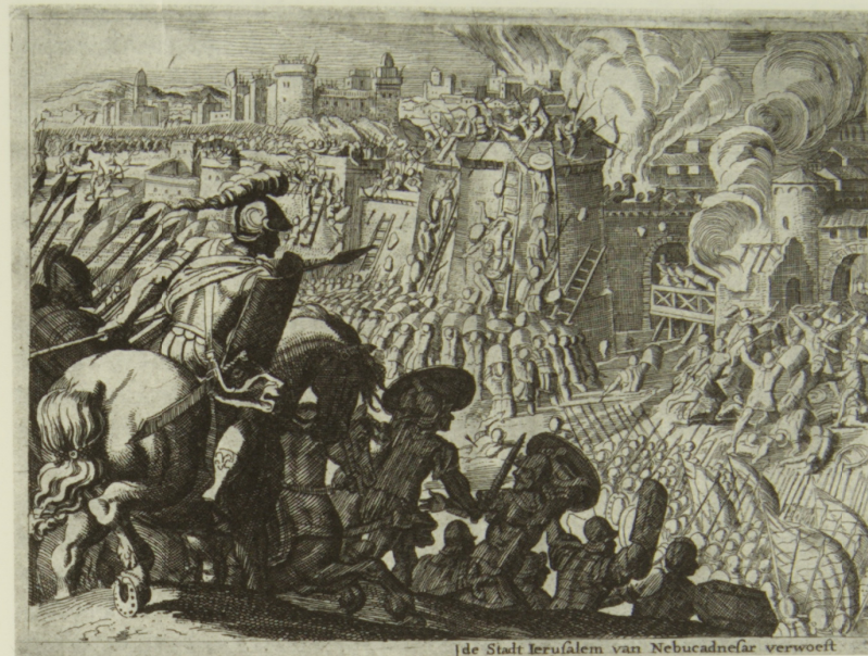
De Stadt Ierusalem van Nebucadnesar verwoest

appearance of this figure in a biblical scene is nonetheless surprising.' Pieter van Thiel schrijft enkele jaren later: 'Ook deze bron [Flavius Josephus] verklaart niet de aanwezigheid van de figuur met de fakkel boven de stad. Voor deze raadselachtige verschijning is nog geen bevredigende verklaring gevonden.' 17