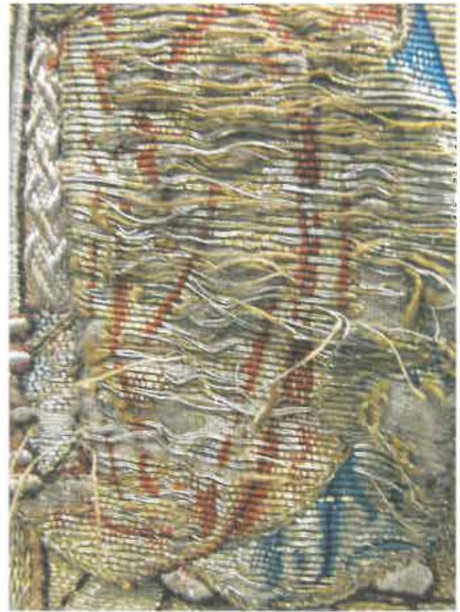
6.4 Bruine borduurgarens zijn vaak verdwenen door degradatie. Ze zijn regelmatig gerestaureerd met nieuw garen dat opvalt door de donkere bruine kleur. Beeldje van een aurifries met Paulus, Holland, ca. 1500-1510. Utrecht, Museum Catharijneconvent, ABM t2121b (detail)