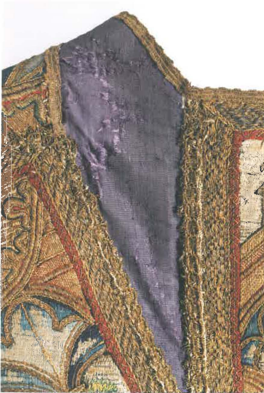
6.12 De zijde werd ondersteund met een katoenen steunweefsel en spansteekjes, uitgevoerd met paarse 'zuivere Turijnse' zijde. Utrecht, Museum Catharijneconvent, BMH t2911 (detail)