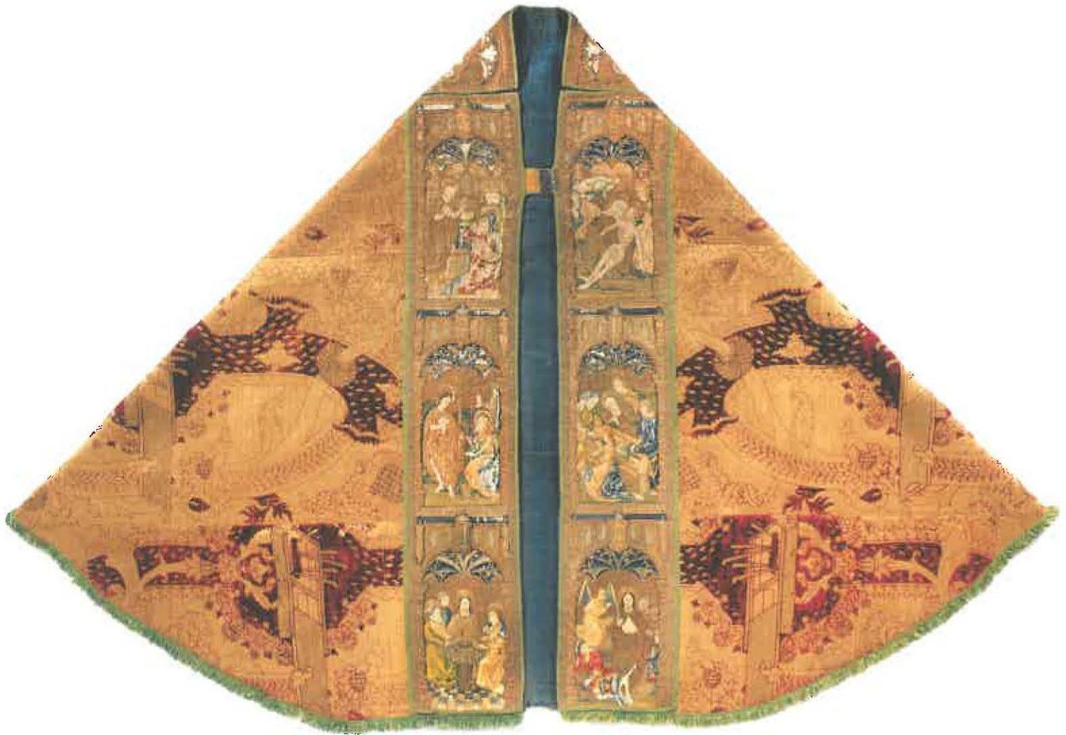
6.11 Koorkap van bisschop David van Bourgondië met voorstellingen uit het leven van Christus, Noord-Nederland, Utrecht, ca. 1475-1496. Utrecht, Museum Catharijneconvent, ABM t2003

lier, vroeg in het bijzonder aandacht voor textiel en spande zich in om uitwisseling van kennis tussen onderzoekers en beheerders van textielcollecties tot stand te brengen. Een nieuw platform daarvoor zag in datzelfde jaar het licht: de Textielcommissie Musea. 27 Men onderkende een gebrek aan opleiding op het gebied van textielconservering. Tot de kernactiviteiten van de commissie behoorde dan ook het organiseren van cursussen en bijeenkomsten, die 'Textieldagen' werden genoemd, voor hen die belast waren met het beheer van textielcollecties in Nederland. Zelf deed de textielcommissie geen onderzoek, dat zou plaatsvinden in het CL. De opzet van een centraal restauratieatelier voor textiel leek de meest geschikte weg om greep te krijgen op de problemen die zich bij textielbehoud voorde-