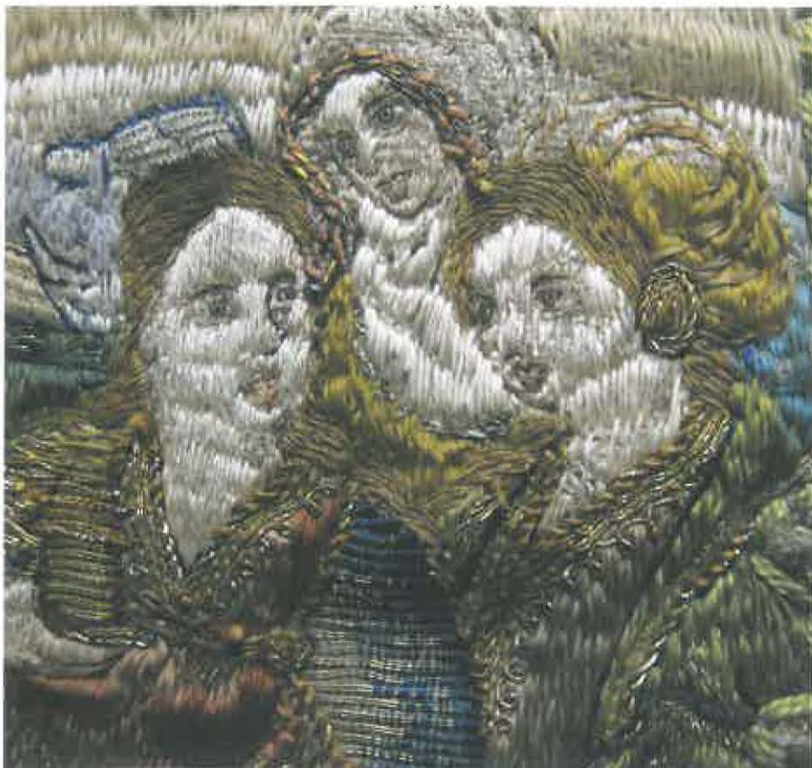
6.2 Dit detail laat een niet vakkundig uitgevoerde restauratie van middeleeuws borduurwerk zien. Van de oorspronkelijk zeer verfijnde detaillering in de gezichten is weinig meer over. Kazuifel, Zuid-Nederland, ca. 1530-1550. Utrecht, Museum Catharijneconvent, ABM t2327 (detail)