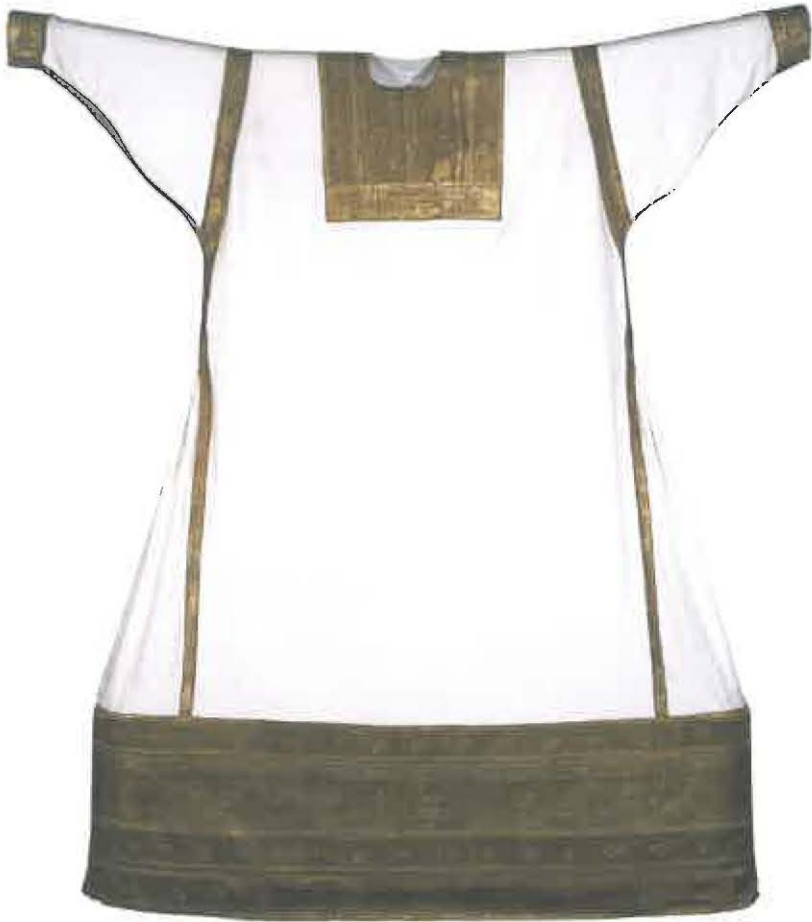
6.10 Albe met langs hals, mouwen en zoomranden van goudbrokaat met ingeweven plant- en dier- motieven, zogenaamde albe van Bernulphus, Sicilië, ca. 1150. Utrecht, Museum Catharijneconvent, OKM t91 (geheel en detail)