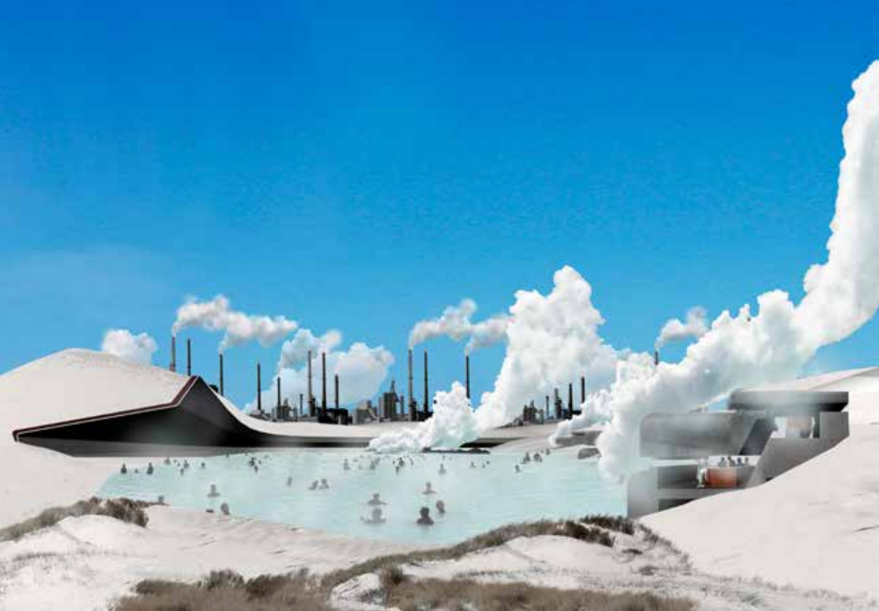
Hot Spring & Steaming Bunkers: In Generating Dune Scapes, surplus sand and residual industrial heat are used to create the first winter bathing resort in Western Europe (Prix de Rome, Ronald Rietveld, 2006).