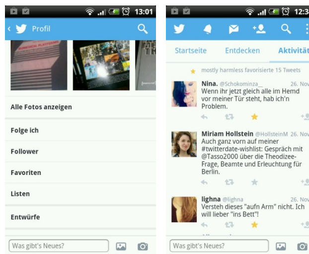
Abb. 6: In der Profilsicht der Version 5.0.4 kann man nach wie vor (relativ umständlich) die eigenen Favoriten aufrufen (links). Die Favoriten derjenigen, denen man folgt, kann man relativ leicht im Tab ‚Aktivität‘ sehen (rechts). Wenn jemand mehrere Tweets favt, wird dies bis zu einem Maximum von 15 numerisch angezeigt.

Durch die explizite Darstellung von erhaltenen Favs in der aktuellen App wird die Nutzungsvariante als Gabe im Vergleich zur Version 1.0 nicht nur grundsätzlich ermöglicht, Nutzer werden auch erstmals auf erhaltene Favs und damit die Möglichkeit, diese als Gaben zu nutzen, aufmerksam gemacht. Darüber hinaus ist die Nutzung des Favs als Bookmark weiterhin ähnlich wie in Version 1.0 möglich: Unten auf der eigenen Profilsseite findet man sechs mögliche Menüpunkte; darunter ‚Favoriten‘ (Abb. 6, links). Während erhaltene Favs quasi auf der Startseite angezeigt werden, bedarf es mehrerer Klicks, die vergebenen Favs zu sehen. Damit treten die Sortier-Aktivitäten eines Nutzers zugunsten des Austauschs mit anderen Nutzern in den Hintergrund: Wichtiger als die Frage, wie man die von anderen getweeteten Informationen organisiert, wird, wie oben bereits erwähnt, „[...] to see what’s happening on Twitter in relation to you“ (Twitter 2011a).