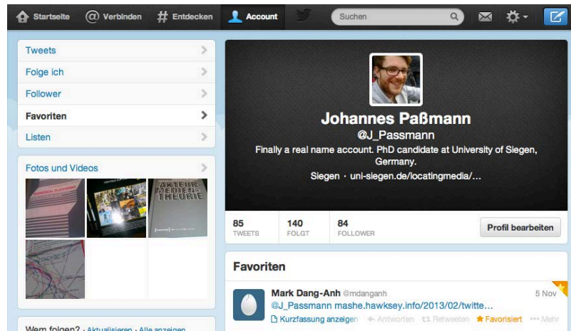
Abb. 2: Das Favoriten-Tab befindet sich im heutigen Webinterface (Stand Januar 2014) auf der linken Seite, wenn man vorher auf ‚Account‘ (oben) geklickt hat.

Wie schon beim Retweet-Button nutzte Twitter hier wieder die schrittweise Strategie des ‚Limited Rollouts‘. Am 10. August 2011 schrieb Twitter auf seinem Blog: „Today, we’re rolling out two new features on Twitter.com that help you discover more on Twitter. You can now see when someone favorites or retweets one of your Tweets“ (Twitter 2011a). Dieses neue Feature eröffnete einen einfachen Weg, „[...] to see what’s happening on Twitter in relation to you“ (ebd.). Für alle sichtbar wurde diese Funktion allerdings erst am 14. November 2011 (@twitter 2011c).