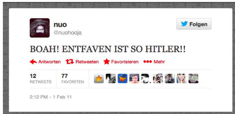
Abb. 1: Screenshot eines Tweets der Nutzerin @nuohooja vom 1. Februar 2011.

Solche und ähnliche Tweets konnte man vor allem unter einer speziellen Nutzergruppe finden, der von uns sogenannten Favstar-Sphäre; dort ist es nämlich die zentrale Alltagspraxis, für ‚gelungene‘ Tweets Favs zu vergeben (Paßmann/Boeschoten/Schäfer 2014). Diese Praktik hat sich in Deutschland um die Drittanbieter-Plattform favstar.fm entwickelt, die für diese Gruppe auch heute noch der mit großem Abstand wichtigste Ort für die Dokumentation und den Vergleich erfolgreicher Tweets ist. Plattformaktivitäten im Allgemeinen und Favs im Besonderen können in diesem Zusammenhang als spezielle, sich oft wandelnde und teils stark hierarchisierte Form des Gabentauschs verstanden werden (vgl. ebd. sowie Jörissen 2011). Und eine Gabe zurückzunehmen, ist in der Tat eine ziemliche Gemeinheit – dies erklärt das Ausmaß der Entrüstung, mit der sich @nuohooja äußert.