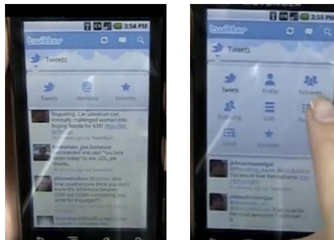
Abb. 4: Version 1.0 der offiziellen Twitter-App für Android. Links sieht man die eigene Timeline, von dort aus kann man auf die eigenen, ‚vergebenen‘ Favs zugreifen. Rechts sieht man das Profil eines fremden Accounts. Man kann sich dessen Follower, Listen und vieles mehr ansehen. Ganz am Ende der Optionen kann man sich auch ansehen, wessen Tweets er favorisiert hat.