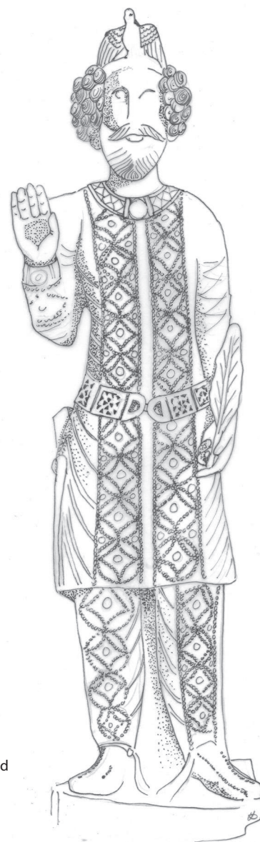
3. Levensgroot standbeeld van Koning Sanatruq I, met diadeem en adelaar

Dat de koning een speciale band had met Shamash blijkt ook uit een inscriptie waarin de oprichting van een beeld van koning Sanatruq II wordt herdacht. De koning wordt hier getypeerd als dgndh 'm 'lh' , wat zoiets betekent als