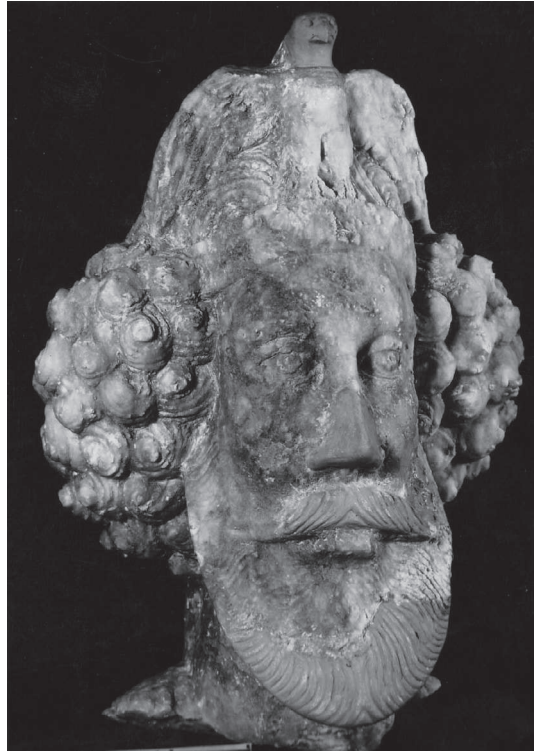
4. Hoofd van een levensgroot standbeeld van Koning Sanatruq I, met diadeem en adelaar (voor en na restauratie)