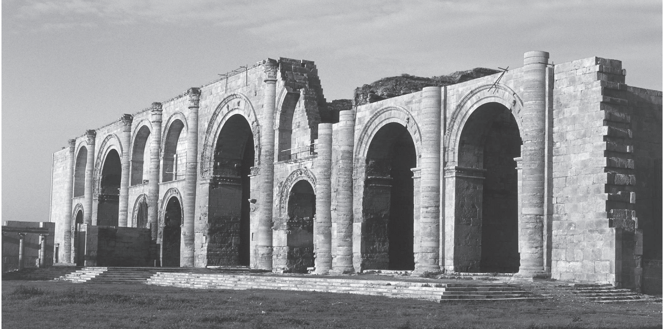
2. Façade van de grote iwans in de centrale temenos