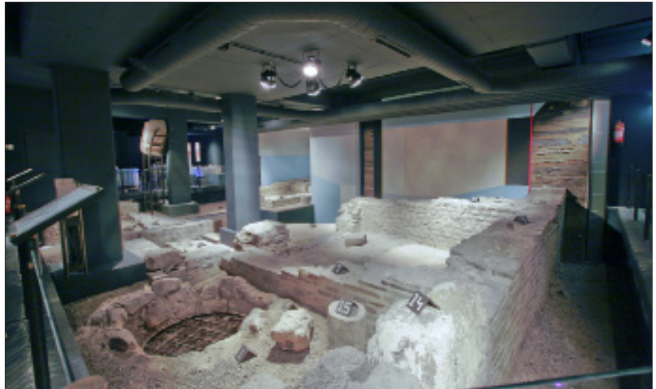
Afb. 10. Op 25 maart 2013 is het precies vijftienvijftig jaar geleden dat de Museumkelder onder Hotel Derlon te Maastricht werd geopend.

In de voorbije vijftig jaar is de archeologie min of meer volwassen geworden. Deze bijdrage behandelt slechts de provinciaal-Romeinse archeologie, ooit misschien de attractiefste archeologische laag van onze provincie, tegenwoordig gelukkig vergezeld door de hele prehistorische en middeleeuwse stratigrafie. Op alle fronten is het vak in hoog tempo veranderd, in de wetenschappelijke benadering, de organisatie van het onderzoek, de opleiding, de documentatie, de technische hulpmiddelen, de natuurwetenschappelijke hulpwetenschappen en, last but not least , de wettelijke onderbouwing en maatschappelijke acceptatie. Waren archeologen vroeger zonderlingen of vakidioten die van hun hobby hun beroep hadden gemaakt, tegenwoordig