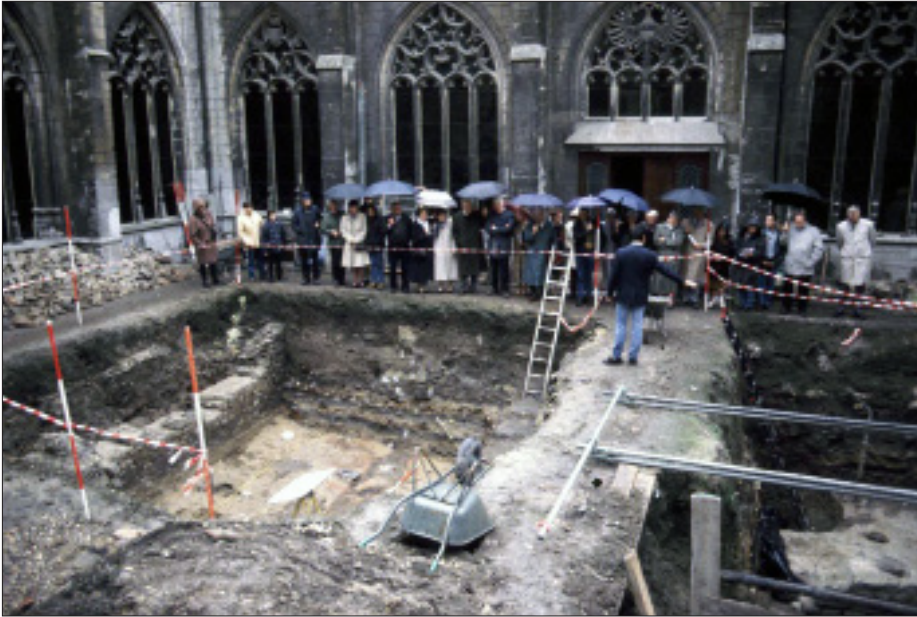
Afb. 8. Wetenschappelijk onderzoek in de Pandtuin van de Onze-Lieve-Vrouwekerk te Maastricht in 1996.