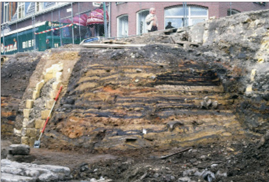
Afb. 6. 'Engels drop' of de vroegmiddeleeuwse Maastrichtse stratigrafie bovenop de Romeinse weg in de opgraving Derlon 1983.