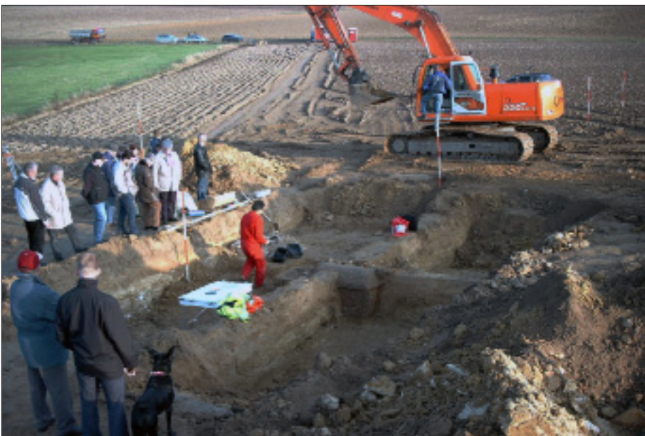
Afb. 9. Ontdekking van een rijk Romeins graf in 2003 in Bocholtz in het open veld.

Archeologisch onderzoek naar de Romeinse bewoningsfase omwille van zuiver wetenschappelijke motieven heeft in Limburg in de laatste vijftig jaar weinig plaatsgevonden. De rol van het Rijksmuseum van Oudheden in Leiden dienaangaande was in 1947 uitgespeeld. Naast de Universiteit van Amsterdam en de Vrije Universiteit, was de Katholieke (nu: Radboud) Universiteit Nijmegen, de enige universiteit met een in de provinciaal-Romeinse archeologie gespecialiseerde en actieve afdeling. Deze beperkte zich echter tot opgravingen in Nijmegen