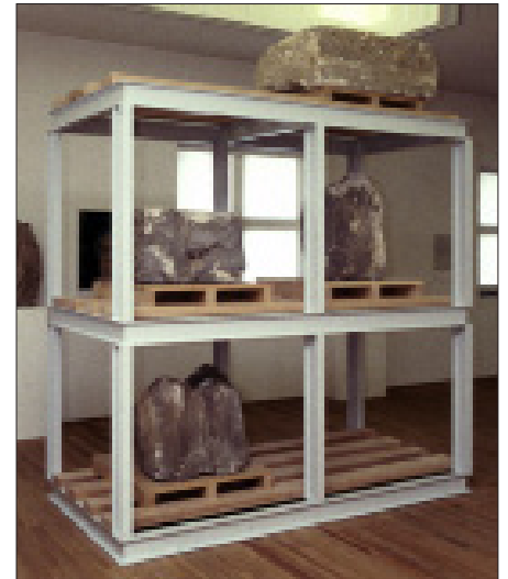
Afb. 7. Stelling met stenen van graftorens in de voormalige archeologische opstelling van het nieuwe Bonnefantenmuseum (1997).

ring leidt tot verwijdering van zuivere wetenschap, en dat de inhoudelijke betrokkenheid achteruit lijkt te gaan. Hierbij moeten we helaas aantekenen dat ook de universiteiten steeds minder ruimte hebben voor wetenschappelijke onderzoeken.