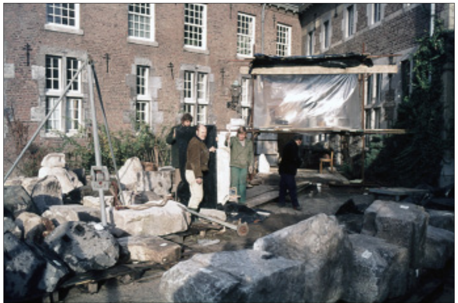
Afb. 5. Opname van de documentatiewerkzaamheden in 1974 van de stenen uit de Romeinse Maasbrug te Maastricht aan de achterzijde van het eerste Bonnefantenmuseum aan de Bonnefantenstraat te Maastricht.