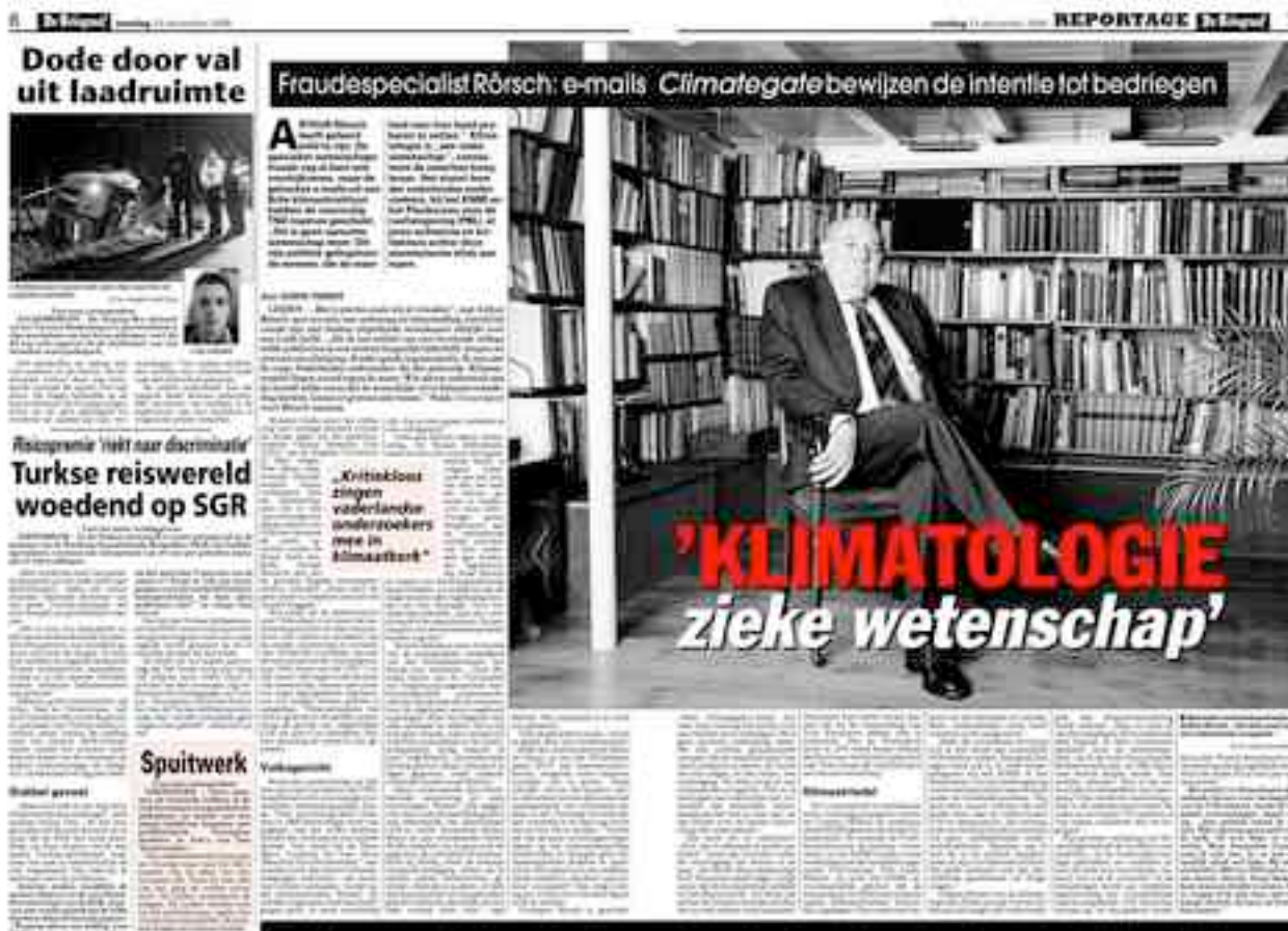
De Telegraaf, 13-12-2009.