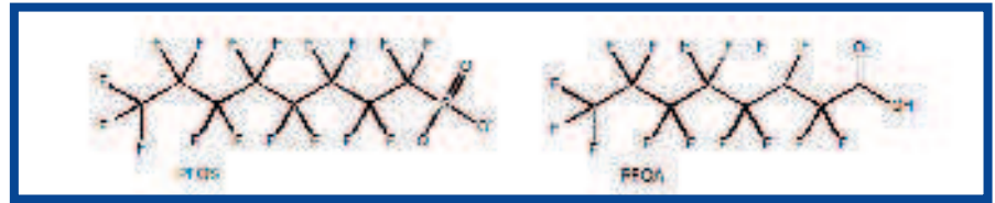
Afb. 1: Structuur van PFOA en PFOS.