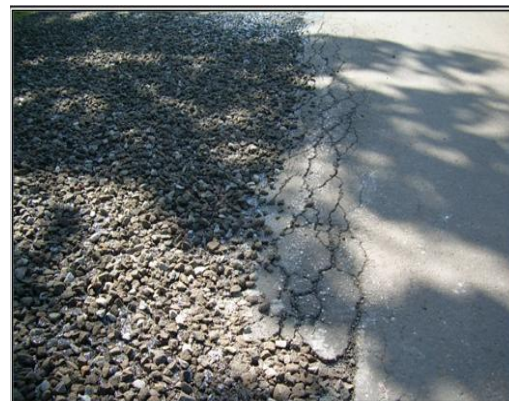
Gambar 4. Kerusakan dini lapisan perkerasan jalan

Kerusakan-kerusakan lapisan perkerasan seperti diuraikan di atas pada dasarnya merupakan kerusakan yang terjadi setelah jalan dilalui oleh kendaraan. Tapi ada kerusakan yang lebih parah lagi yaitu terlepasnya sebagian material perkerasan jalan sebelum dilalui oleh kendaraan, material lapisan perkerasan tidak menyatu walaupun telah dilakukan pematatan dan kerusakan terjadi beberapa saat setelah pematatan dilakukan, dimana seakan-akan tidak adanya daya ikat antara agregat, seperti terlihat pada Gambar 4.