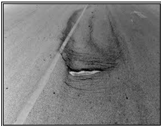
Gambar 2. Retak Selip

Retak selip ( slippage cracks ), retak yang bentuknya melengkung seperti bulan sabit. Hal ini terjadi disebabkan oleh kurang baiknya ikatan antara lapis permukaan dengan lapis di bawahnya. Kurang baiknya ikatan dapat disebabkan oleh adanya debu, minyak, air, atau benda non-adhesif lainnya, atau akibat tidak diberinya tack coat sebagai bahan pengikat di antara kedua lapisan. Retak selip pun dapat terjadi akibat terlalu banyaknya pasir dalam campuran lapisan permukaan, atau kurang baiknya pematatan lapis permukaan, retak selip dapat dilihat pada Gambar 2.