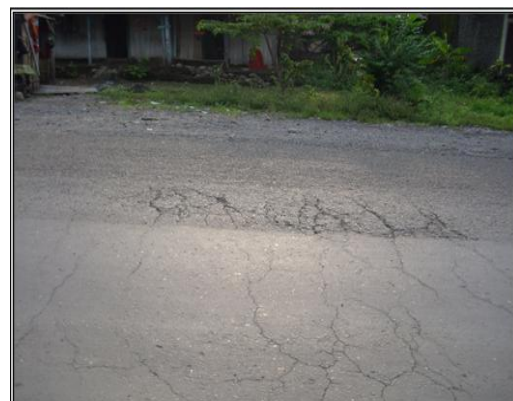
Gambar 1. Retak Halus

bagian perkerasan di bawah lapis permukaan kurang stabil (Gambar 1).