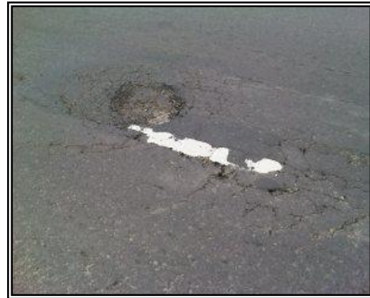
Gambar 3. lubang ( potholes )

Cacat permukaan ( disintegration ), yang mengarah kepada kerusakan secara kimiawi dan mekanis dari lapisan perkerasan. Cacat permukaan ini lama-kelamaan dapat menyebabkan lubang ( potholes ). Kerusakan ini pada mula berbentuk seperti mangkok, ukuran bervariasi dari kecil sampai besar. Lubang-lubang ini menampung dan meresapkan air kedalam lapisan permukaan yang menyebabkan semakin parahnya kerusakan jalan (Gambar 3). Lubang dapat terjadi akibat campuran material lapis permukaan jelek, seperti Kadar aspal rendah, sehingga film aspal tipis dan mudah lepas. Agregat kotor sehingga ikatan antara aspal dan agregat tidak baik. Temperatur campuran tidak memenuhi persyaratan. Lapis permukaan tipis sehingga ikatan aspal dan agregat mudah lepas akibat pengaruh cuaca, sistem drainase jelek dan retak yang tidak ditangani dengan baik.