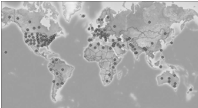
Karta 1. Distribucija Avena fatua u svetu ( https://www.cabi.org )

Danas je A. fatua široko rasprostranjena vrsta u različitim agro-ekosistemima od umerenih do sub-tropskih područja (Karta 1) zahvaljujući specifičnim karakteristikama semena, njegovoj visokoj klijavosti, visokoj kompetitivnosti i alelopatskom potencijalu. Ova vrsta ima širi areal rasprostranjenja, izraženiju adaptibilnost i veće probleme stvara u poljoprivredi nego vrsta A. ludoviciana (Bajwa et al., 2017; Jäck et al., 2017) koja je takođe kod nas prisutna kao korov ali u znatno manjoj brojnosti. Iako na području naše zemlje raste od davnina, Shala (1987) ističe da se divlji ovas pominje tek 1957. godine kao problematična korovska vrsta na oranicama Šumadije. Od tada divlji ovas na nekim područjima Srbije postaje sve veći problem. Danas, A. fatua je među prvih nekoliko ekonomski najštetnijih korovskih vrsta useva strnih žita. Rasprostranjena je gotovo u svim područjima, gde je prisutna u manjoj ili većoj brojnosti, a najugroženije teritorije su centralna, zapadna i južna Srbija, Timočka Krajina i Kosovo (Karta 2) (Vrbničanin i sar., 2008). Kada je reč o A. fatua u zakonskoj regulativi iz oblasti zaštite i zdravlja bilja R. Srbije, u propisima koji se odnose na proizvodnju i promet semena strnih žita i semenskih trava, ova vrsta je predmet striktno kontrole (Vrbničanin i sar., 2011).