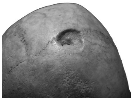
2. ábra: Gyógyult trauma nyoma (véltetően sebészti trepanáció) a sutura coronalis mentén a koponya bal oldalán.

Fig. 2: Sign of healed trauma (possibly surgical trepanation) along the left coronal suture.