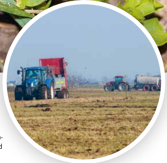
Foto 3. Links wordt ruige stalmeest uitgestrooid, rechts wordt drijfmest geïnjecteerd.