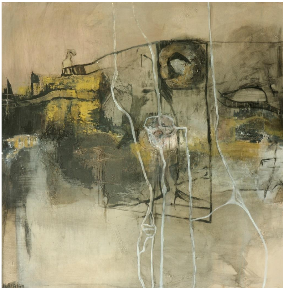
Apenas corazón, técnica mixta. Mabel Di Liscia