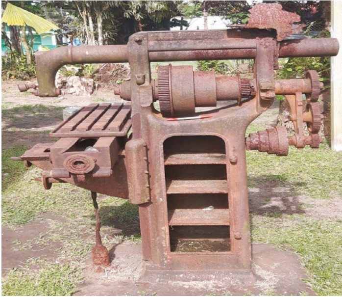
Figura 6. Brainard Milling Machine localizada en Tortuguero