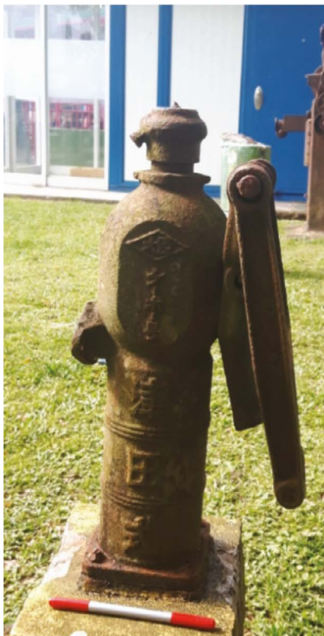
Figura 4. Bomba de mano para extracción de agua, marca Tsuda —origen japonés—, hallada en el sitio arqueológico industrial Tortuguero