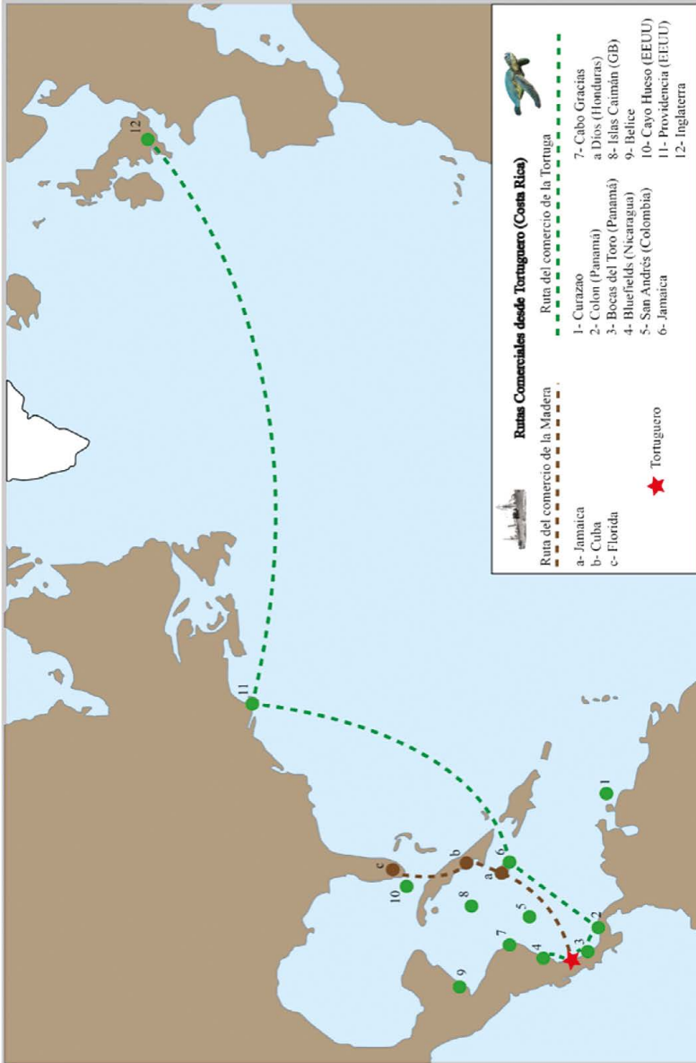
Figura 1. Mapa que sintetiza las rutas comerciales desde Tortuguero, se enfatizan los principales productos extraídos y explotados allí: las tortugas y la madera

Fuente: Elaboración propia con base en datos de las obras citadas de Lefever, Parsons y Roberts. Digitalizado por el Lic. Marco Arce Cerdas, arqueólogo.