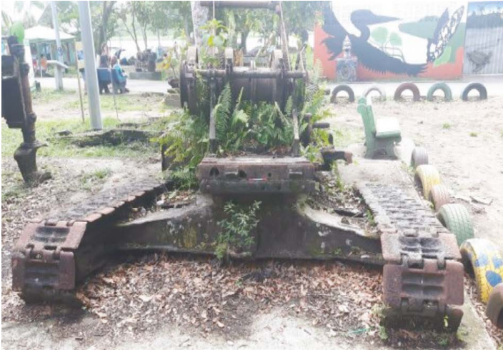
Figura 5. Restos de maquinaria Caterpillar

Entre la maquinaria más sobresaliente —por su tamaño— se encuentra un tractor de oruga de marca Caterpillar —ver figura 5—, el cual pudo facilitar el levantamiento, acomodo y transporte de troncos, tanto en el lugar de extracción como a su llegada al aserradero de Tortuguero. La empresa Caterpillar Inc. surgió en 1925, tras la fusión de la Holt Manufacturing Co. y C. L. Best Gas Tractor Co. , con sede en Illinois, Estados Unidos. 44