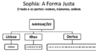
Sophia: A Forma Justa . O todo e as partes: nomes, números, ordem , imagem da minha autoria.

A primeira parte, Lisboa , tem 1 poema; a segunda, Ilhas , tem 7; a terceira, Deriva , tem 17 (cfr. Figura 3).