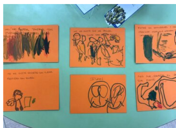
Figura 3. Deseos: “no me gusta”