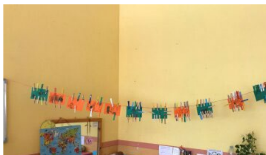
Figura 4. Tendero de los deseos