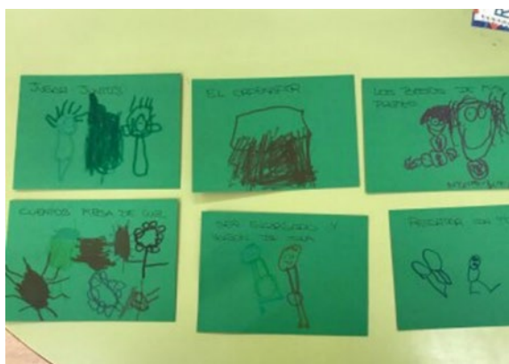
Figura 2. Deseos: “me gusta”

pinza en aquellos deseos con los que estén de acuerdo (ver Figura 4). Según el número de pinzas que haya en cada deseo podremos ver el grado de acuerdo y desacuerdo de la clase, lo que supone una información muy valiosa de aquellos aspectos que han resultado aceptados y valorados, o, por el contrario, no han sido aceptados de la manera esperada. Esta actividad nos da la oportunidad de cambiar aquellas experiencias que no cuentan con la aceptación de los alumnos y de la misma manera, seguir afianzando y consolidando aquellos otros que cuentan con la aceptación de la clase.