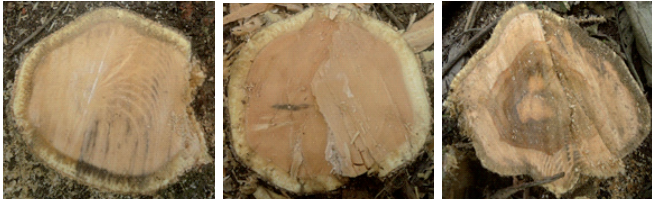
Figura 2. Cortes transversales en la base de árboles de teca enfermos (5 – 10 cm sobre el nivel del suelo) muestran la ausencia de necrosis y daños vasculares. A y B = árboles de 2 años de edad, C = árbol de 7 años de edad.

hacia arriba, colonizando la madera de albura y duramen, ocasionado necrosamiento y taponamiento de los tejidos vasculares, que finalmente conllevan a la muerte del árbol. En algunas ocasiones las heridas no se encuentran cicatrizadas, sino expuestas, desde donde emanan constantemente fluidos de color café con olor astringente, características que indican al árbol como enfermo (Figura 4).