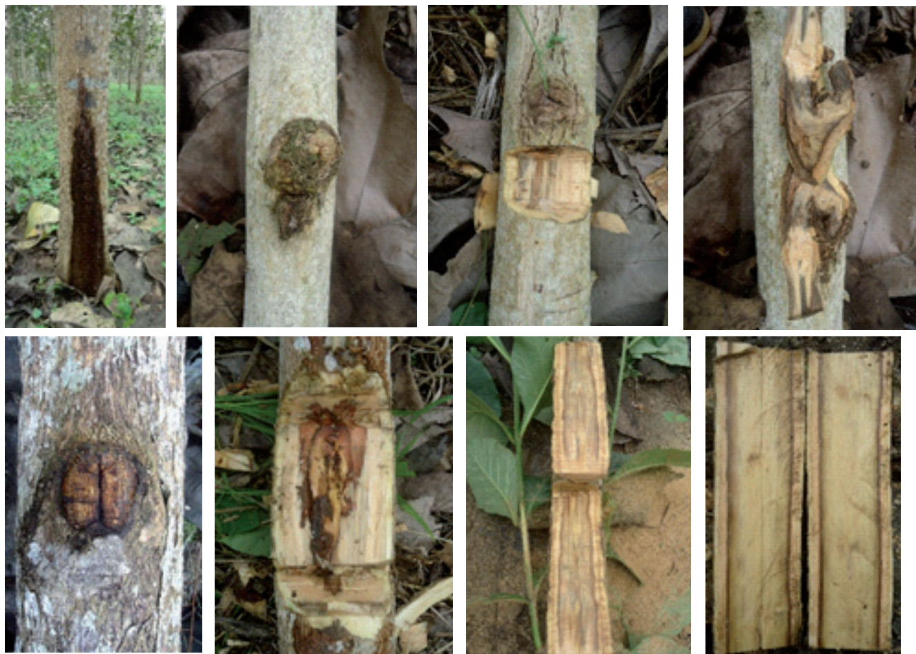
Figura 4. Heridas naturales y mecánicas cicatrizadas y no cicatrizadas, como puntos de ingresos y posterior diseminación en tejidos vasculares del o los fitopatógenos asociados a la enfermedad de marchitez vascular y muerte regresiva de árboles de teca.

Incidencia y severidad de la enfermedad. En la plantación de 2 años de edad, se detectó en promedio 4 árboles enfermos, y 3 árboles muertos por parcela (500 m 2 ), lo que permitió inferir la existencia de 80 árboles enfermos y 60 árboles muertos por ha -1 . En las parcelas de la plantación de 5 años, en promedio se encontraron 2 árboles enfermos y 1 árbol muerto, lo que derivó en 40 árboles enfermos y 20 árboles muertos por ha -1 . Mientras que, en la plantación de 7 años, se halló 1 árbol enfermo, y 1 árbol muerto en promedio por parcela, cuyos resultados representaron 20 árboles enfermos, y 20 árboles muertos por ha -1 . Estos resultados permitieron determinar que la incidencia de la enfermedad fue del 16.6%, 15.2%,