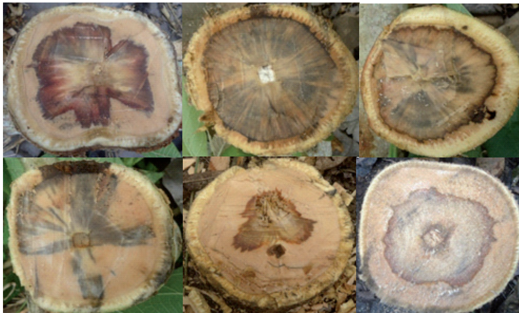
Figura 3. Diferentes tipos de daños detectados mediante cortes transversales en árboles de teca enfermos (sobre los 50 cm del nivel del suelo), evidenciando necrosis en la albura, duramen, y taponamiento de tejidos vasculares.