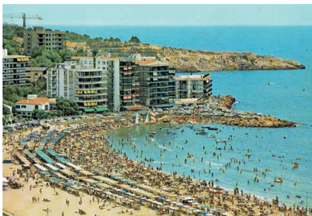
Playa del Lazareto de Salou.

Los resultados de esta reflexión se expresaron en formatos muy diferentes: cartografías, análisis visuales y textos comparativos y reflexivos que dieron lugar a comunicaciones, exposiciones, trabajos de investigación e incluso proyectos fin de grado.