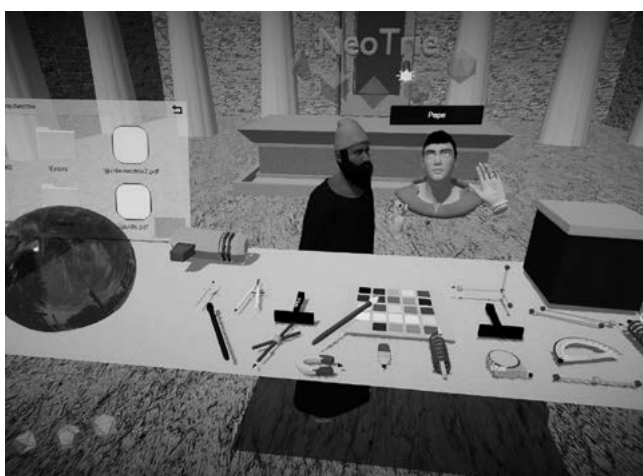
FIGURA 2. Mesa de herramientas de NeoTRie VR