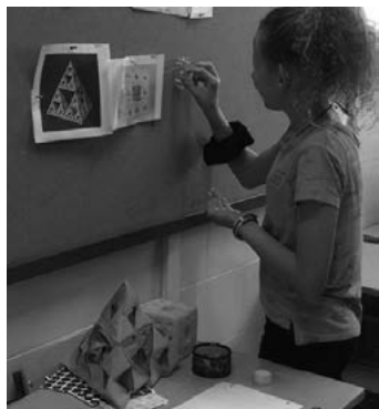
FIGURA 4. Muestra de algunos fractales a construir

El primer paso consistió en mostrar a los estudiantes los fractales que debían construir con NeoTrie VR (ver figura 4). Durante una breve reunión de grupo, ellos acordaban las estrategias que debían seguir en la construcción de los fractales, para posteriormente elegir al integrante del grupo que iba a empezar con la construcción de al menos las dos primeras iteraciones (ver figura 5). Una vez realizadas estas dos primeras iteraciones, el primer integrante entregaba los mandos y las gafas de realidad virtual al segundo integrante para que este hiciera las otras dos iteraciones, y así sucesivamente, hasta que todos los integrantes interactuaban con NeoTrie VR. Durante el tiempo que uno de los integrantes usaba el programa, los demás integrantes estaban atentos a la construcción de los fractales y brindaban indicaciones o sugerencias a su compañero (ver figura 6).