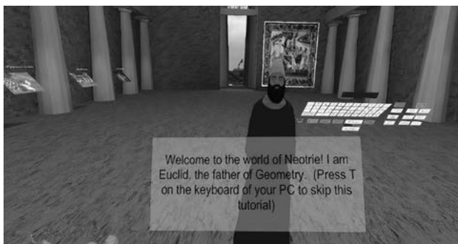
FIGURA 1. Dentro del templo de geometría del entorno NeoTRie VR

Aceptada la invitación, vimos imprescindible que los estudiantes aprendieran la noción básica de los fractales de manera amena, puesto que el objetivo final del evento divulgativo era que esos estudiantes explicaran el concepto de los fractales a los demás estudiantes del IEP El Parador. No había mejor manera de explicar el tema de los fractales cuando se realizan sus construcciones, sobre todo cuando se hace uso de la tecnología que nos brinda la realidad virtual inmersiva del NeoTRie VR. Para alcanzar tal fin, se prepararon tres sesiones de clases: