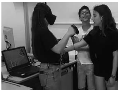
FIGURA 8. Comunicación entre los estudiantes del mismo grupo