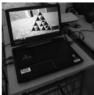
FIGURA 7. Segunda iteración del tetraedro de Sierpiński