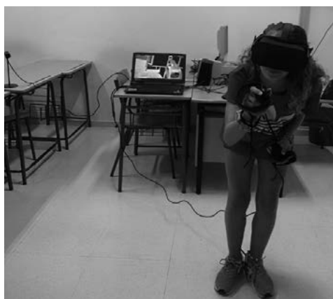
FIGURA 3. Alumna haciendo uso del NeoTrie VR.

Una de las bondades que ofrece NeoTrie VR es el reconocimiento de voz, utilizado para hacer aparecer figuras geométricas como el triángulo (usado en la construcción del triángulo de Sierpiński), el cuadrado (para la alfombra de Sierpiński), el tetraedro con caras (para el tetraedro de Sierpiński) y el hexaedro con caras (para la esponja de Menger). El reconocimiento de voz permite instanciar cuerpos geométricos con caras si se termina su nombre diciendo «[...] con caras». En caso de omitirlo, solo aparece la figura con sus vértices y aristas. Aparte, y por cuenta propia, los alumnos exploraron otras herramientas y opciones disponibles en el entorno virtual de NeoTrie VR.