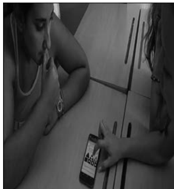
FIGURA 5. Reunión de grupo para buscar estrategias en la construcción de fractales