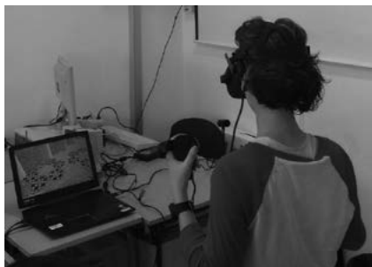
FIGURA 10. Construyendo el hexágono de Sierpiński

En la tercera sesión, como reto final, se propuso la construcción del hexágono de Sierpiński, el cual tiene una mayor complejidad, puesto que requiere un procesamiento más analítico (ver figura 6). Siguiendo las estrategias vistas en la segunda sesión, todos los grupos lograron conseguir el objetivo solicitado.