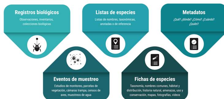
Figura 3. Principales tipos de datos de información que son publicados a través del SiB Colombia. Datos: registros biológicos, eventos de muestreo y listas de especies. Información: Fichas de especies, cifras e indicadores y metadatos.

El SiB Colombia funciona como un punto de integración de los datos e información de la biodiversidad del país, por ende una de sus funciones principales es servir como entrada para el acceso, consulta y uso de los mismos. Actualmente a través del SiB Colombia es posible la publicación de registros biológicos, listas de especies, eventos de muestreo, fichas de especies, y metadatos (Fig 3).