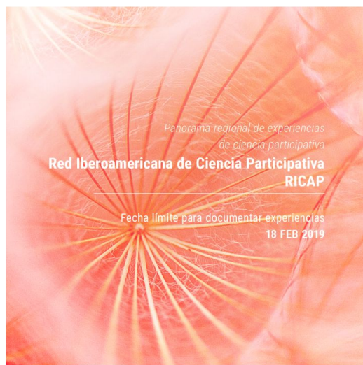
Figura 5. Invitación a participar en la consolidación del Panorama regional de experiencias de Ciencia Participativa

Más información sobre la convocatoria disponible en: https://sibcolombia.net/experiencias-ricap/