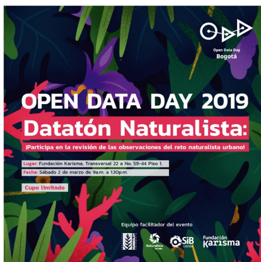
Figura 4. Invitación para participar en la jornada del Dataton Naturalista, realizado en Bogotá el 2 de marzo de 2019.

Memorias del encuentro disponibles en: https://sibcolombia.net/memorias-dataton/