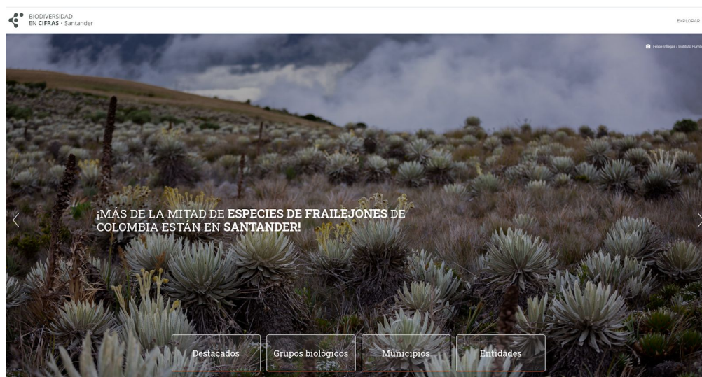
Figura 3: Imagen de inicio de la Ventana Biodiversidad en Cifras - Santander. Disponible en: http://santander.biodiversidad.co/

Este es el primer paso en la regionalización del SiB Colombia. Como herramienta, su objetivo principal es el de responder preguntas fundamentales sobre el estado de la biodiversidad a nivel regional de manera eficaz, sencilla y oportuna.