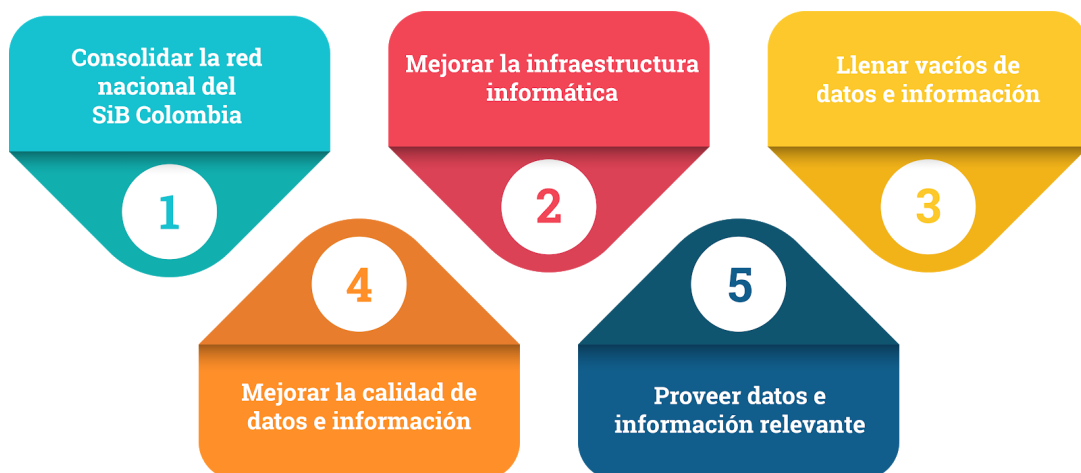
Figura 1. Ejes de trabajo del plan estratégico del SiB Colombia.

En este documento se presentan cada uno de los ejes de trabajo con sus actividades principales . Adicionalmente, se presenta un contexto y un enfoque de implementación para cada actividad principal que facilitan la generación de un conjunto de tareas para cada una de estas. Estas tareas conforman al final el plan de trabajo anual de la red.